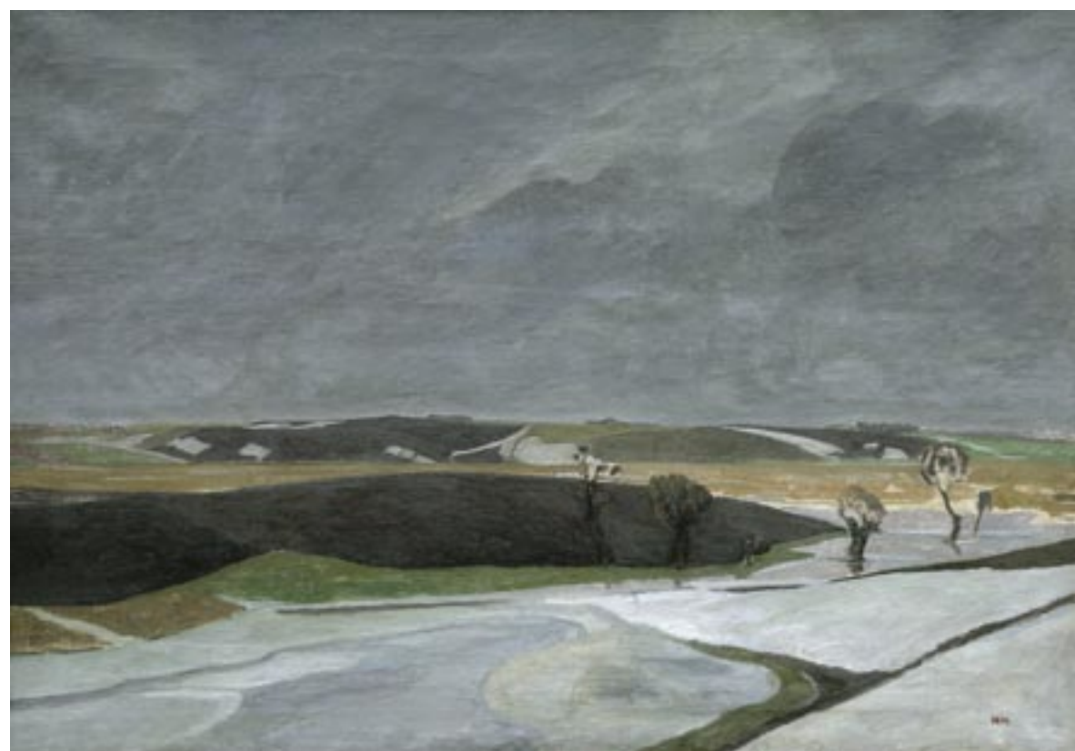
Vinterlandskab, 1917 Olie på lærred, 68 x 97 cm