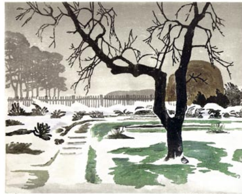
Have i sne Farvetræsnit, 47 x 57 cm