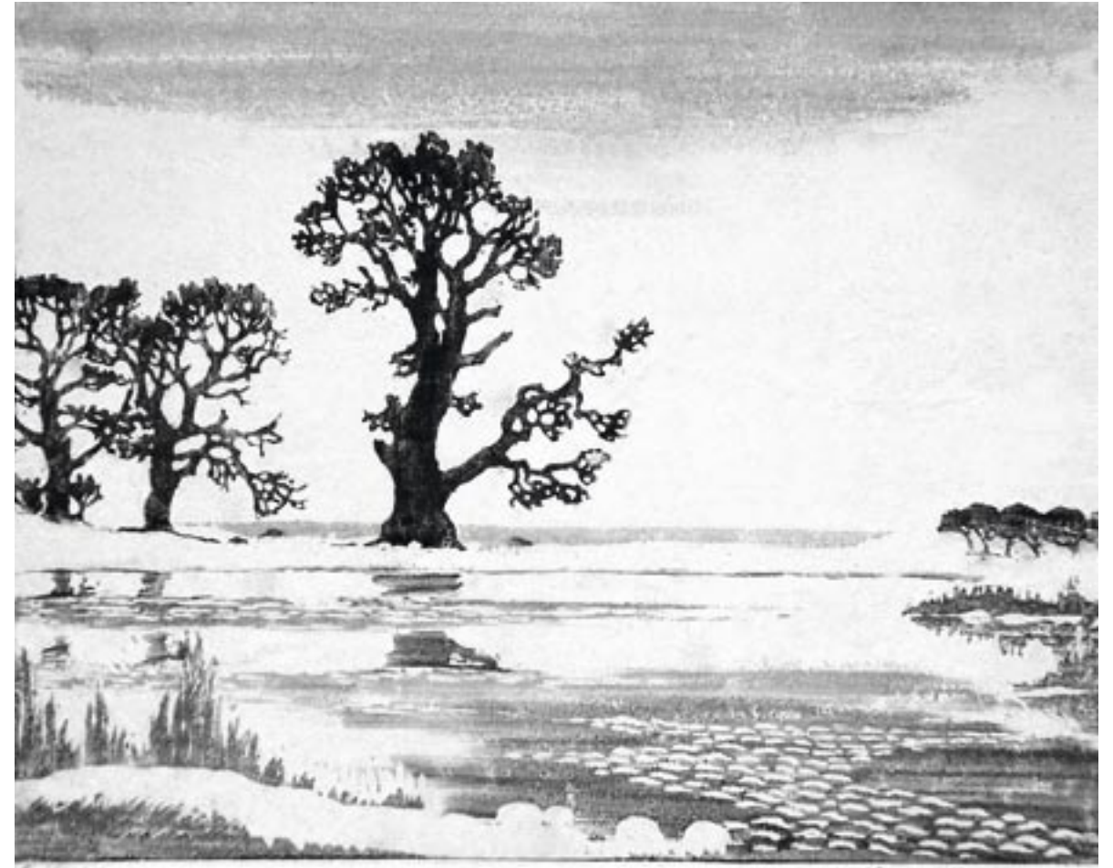
Eget Træg Harald Henriksen Egetræer, Skejten Træsrit, 24 x 28 cm