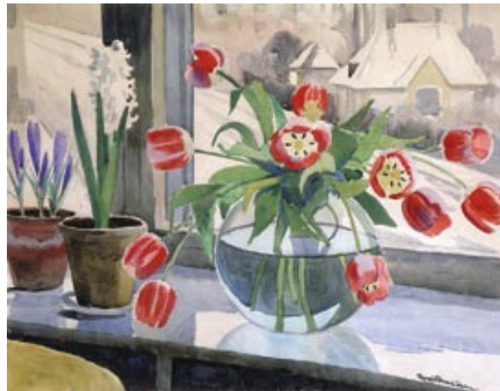
Vindueskarmen, ca. 1945 Akvarel, 46 x 59 cm