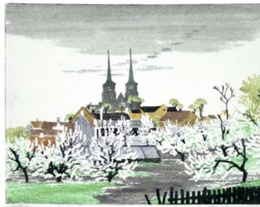
Roskilde, blomstrende frugtræer, 1926 Farvetræsnit, 35 x 43 cm