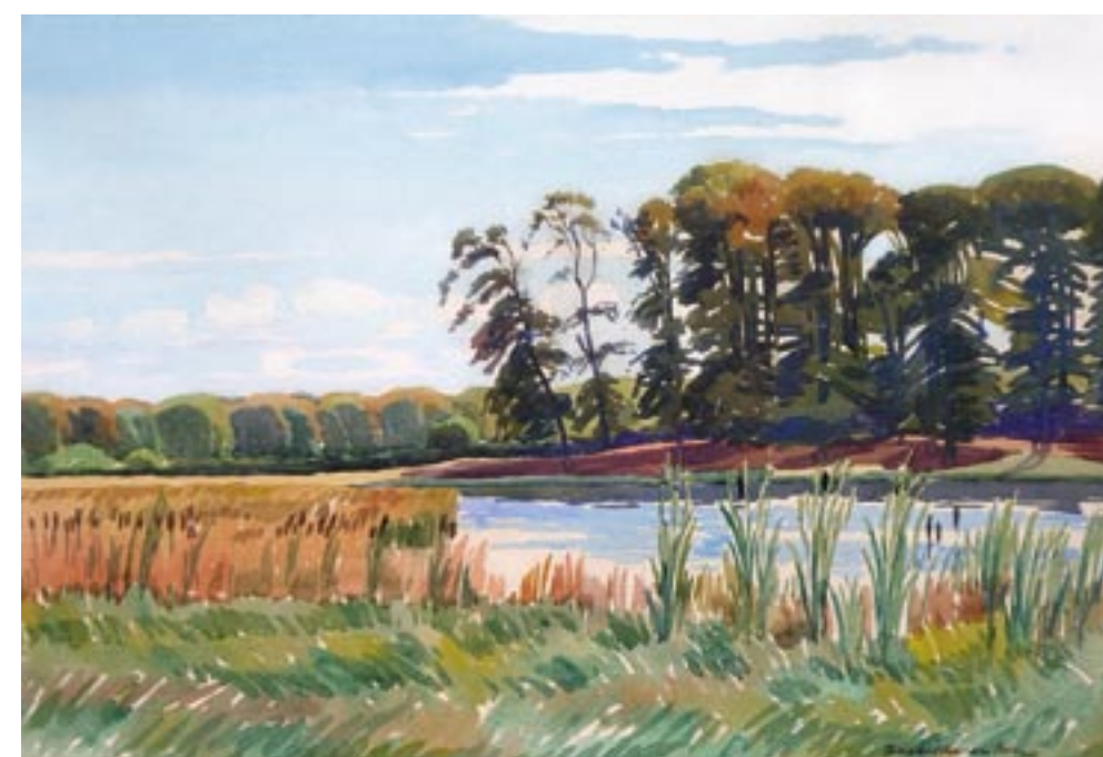
September Akvarel, 32 x 47 cm