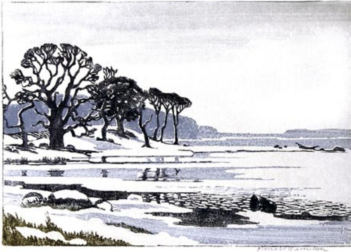
Bognæs, vinter Farvetræsnit, 23 x 31 cm