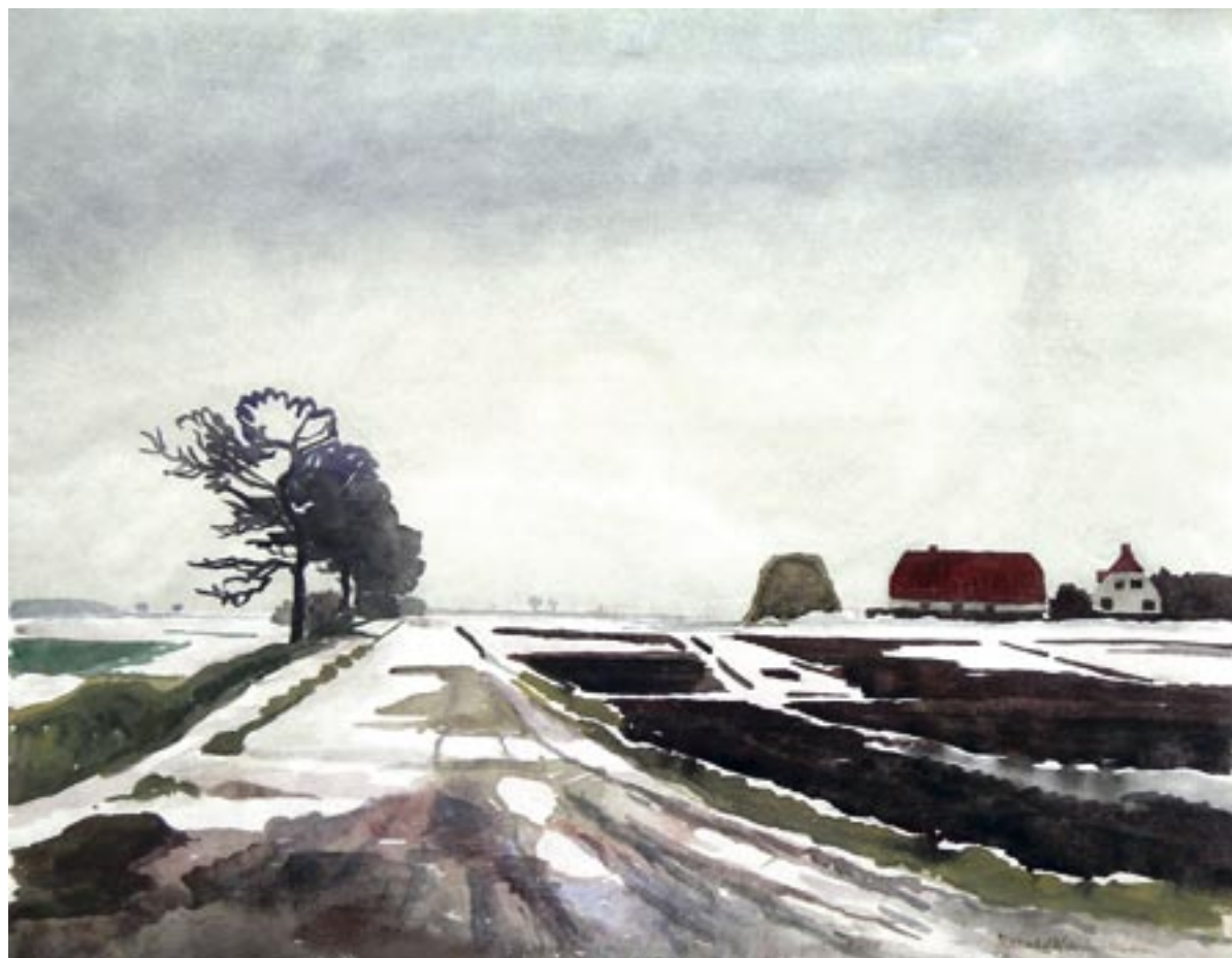
Vinterlandskab, Brøndbyøster, 1960

Et af de sidste billeder, fra januar eller februar. Akvarel, 46 x 59 cm