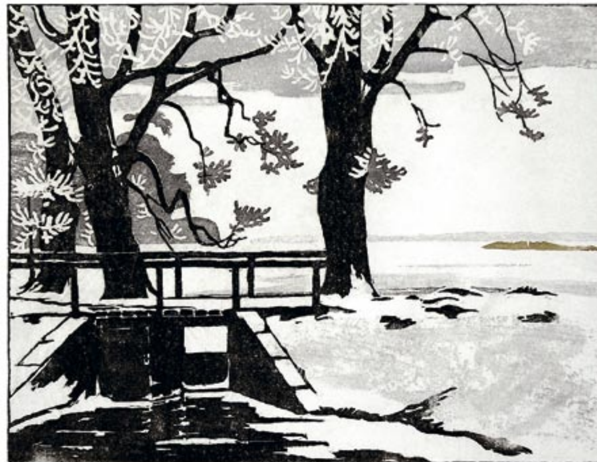
Stemmeværk, vinter Farvetræsnit, 27 x 33 cm