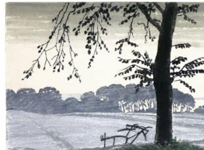
Ved Hindsgavl, udsigt til Fænøssund, ca. 1934 Farvetræsnit, 30 x 41 cm