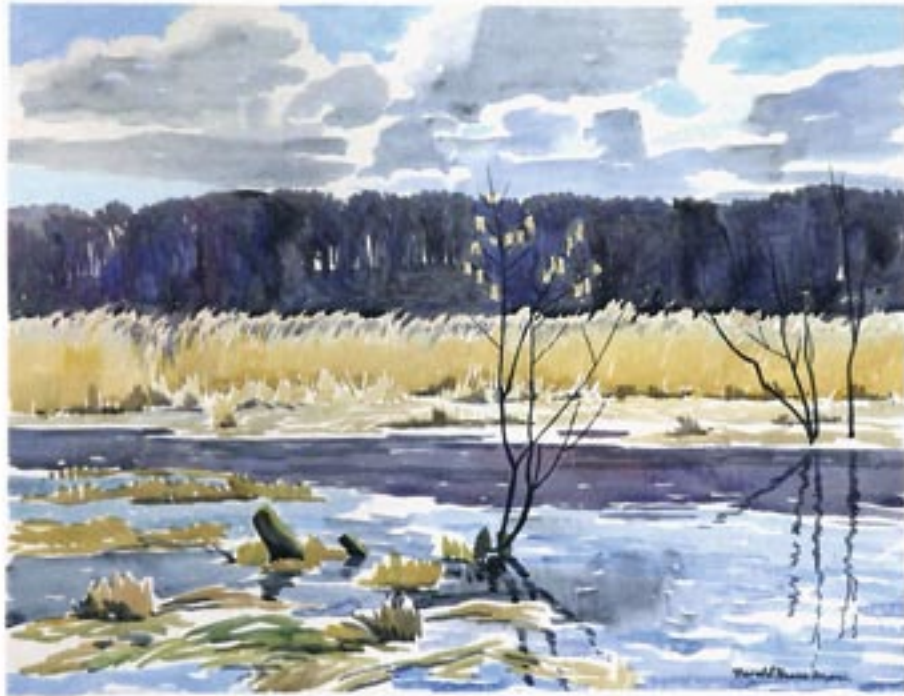
Sø med rørskov, ca. 1942 Akvarel 46 x 59 cm