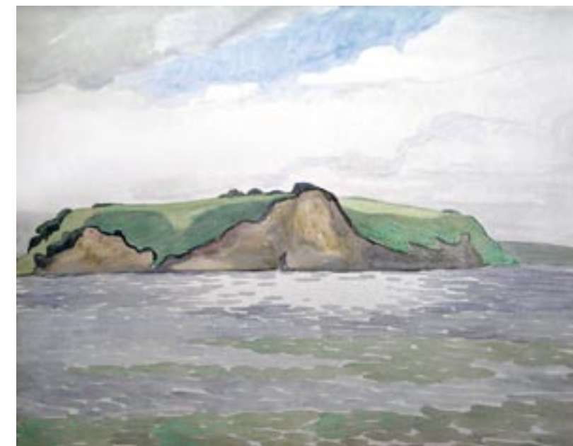
Udsigt mod Mejlø fra Fyns Hoved, 1915 Akvarel, 48 x 62 cm