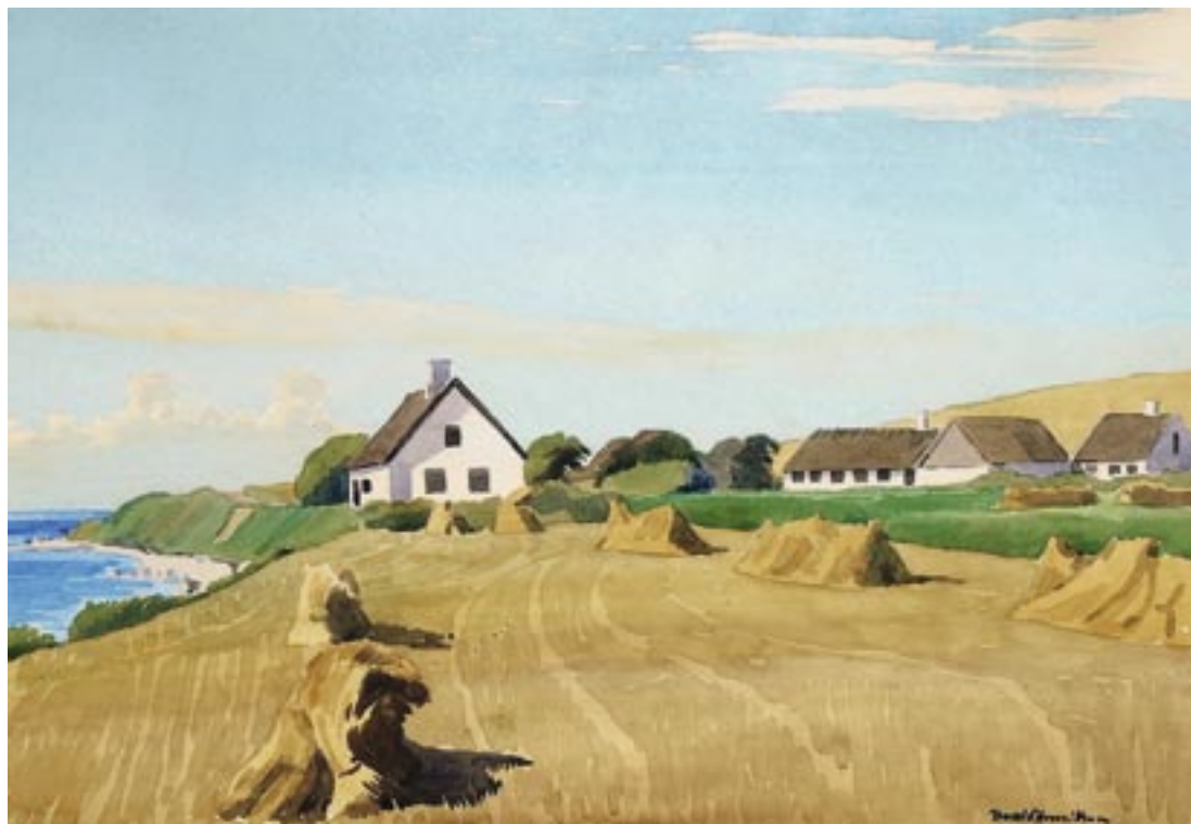
Huse ved stranden, Bjergene 1934