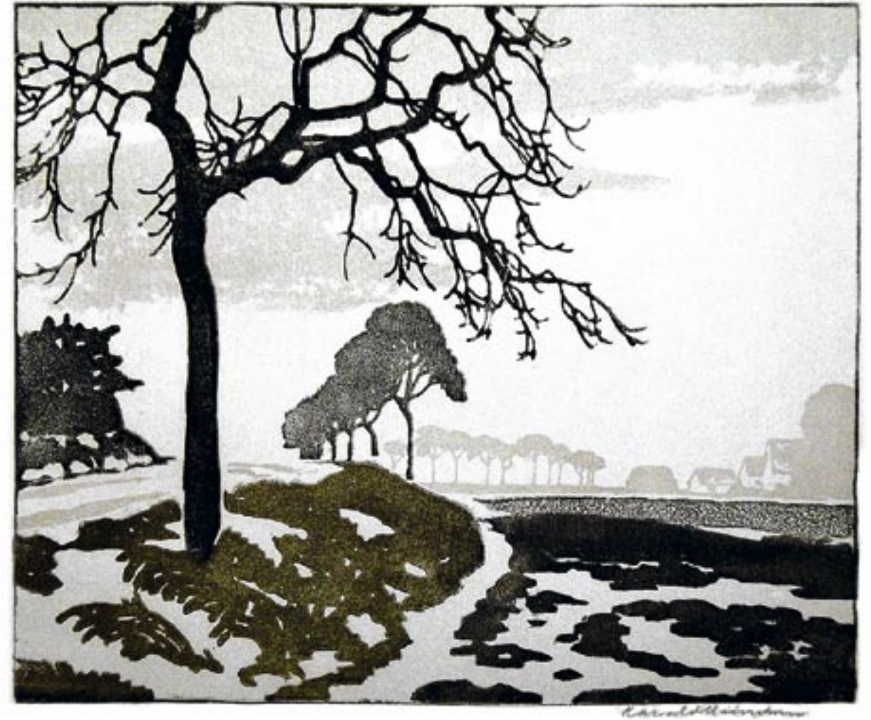
Landevej med træer, vinter Farvetræsniit, 25 x 29 cm