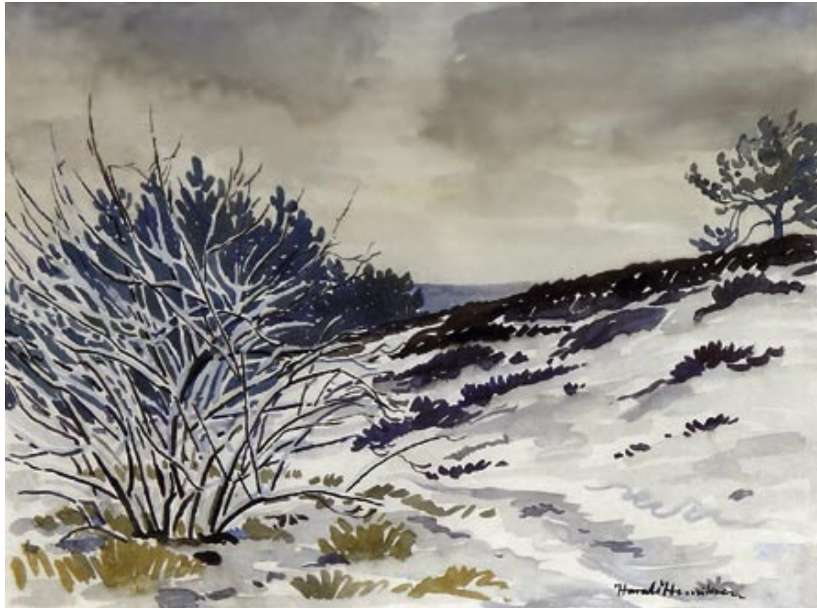
Tibirke Bakker, 1936 Akwarel, 47 x 62 cm