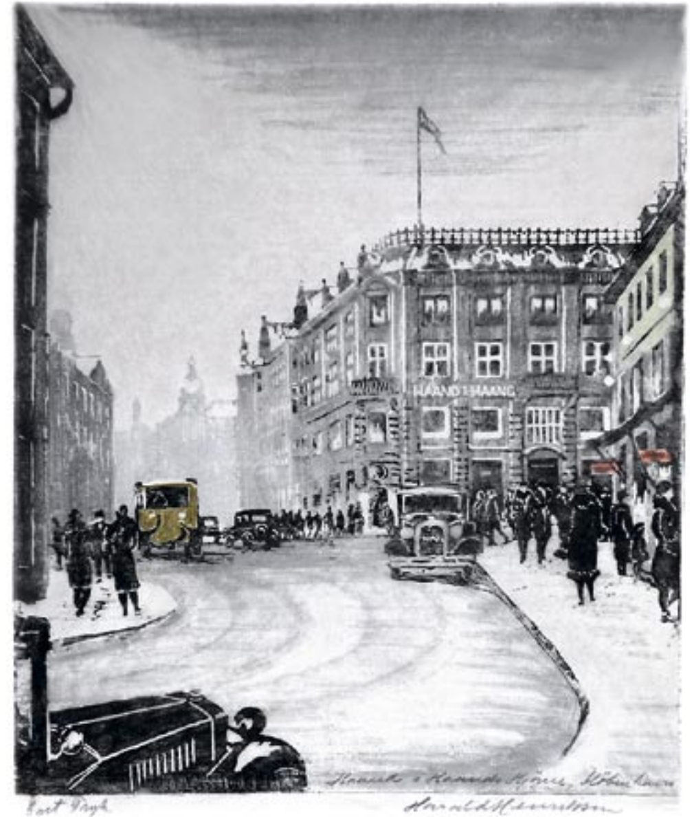
Haand i Haands Hjørne, Strøget, København, ca. 1935

For enhver maler, der dyrker naturen, er der steder, hvor man bare må hente sine motiver. I Danmark har malerne typisk delt sig op i grupper, der hver kom til at dyrke sit særlige landskab: Skagensmalerne, Fynboerne, Bornholmermalerne og Odsherredsmalerne er de kendte eksempler.