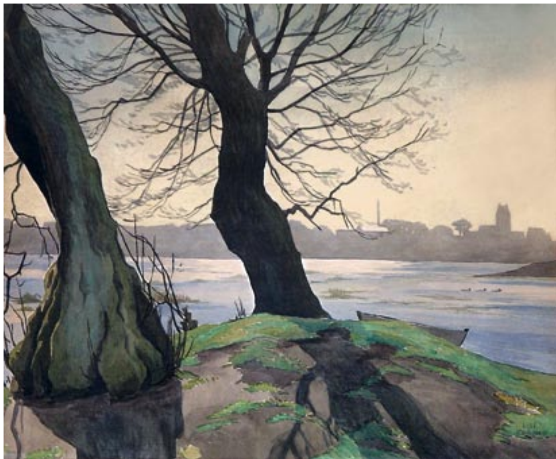
Brønshøj Mose, forår 1923 Akvarel, 44 x 53 cm