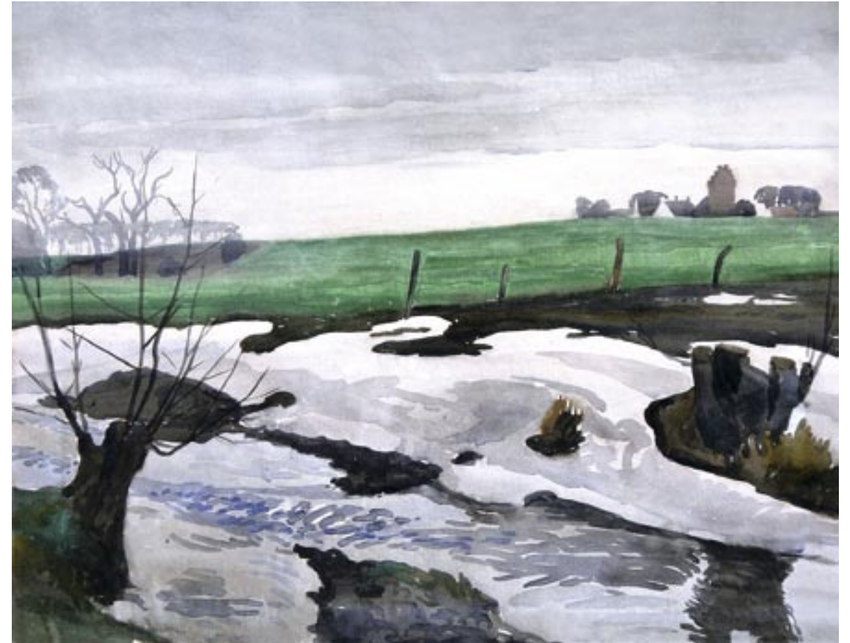
Å i tøjbrud, Lellinge, ca. 1946 Akvarel, 45 x 57 cm