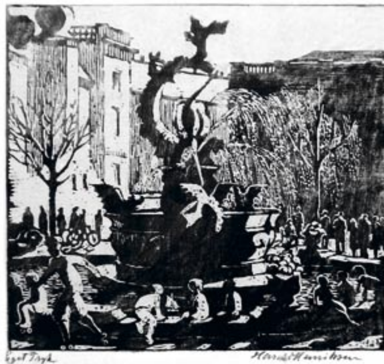
Dragespringvandet, København, ca. 1925 Træsnit, 20 x 22 cm