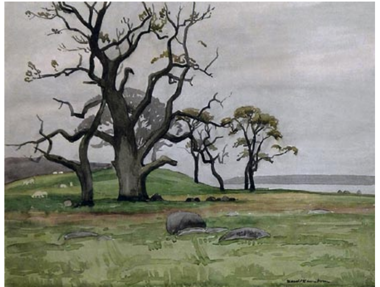
Bognæs, ca. 1926 Akvarel, 45 x 59 cm