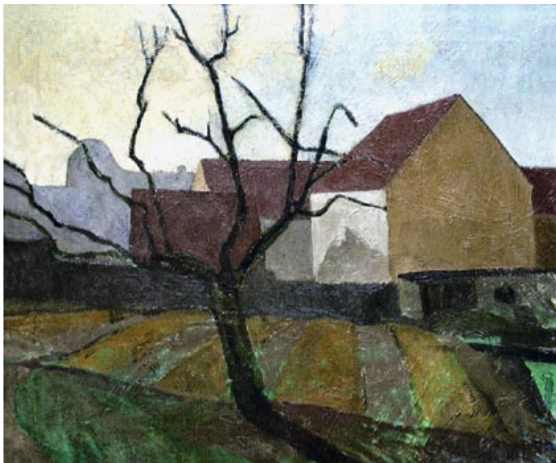
Motiv fra Valby, 1916 Olie på lærred, 56 x 67 cm