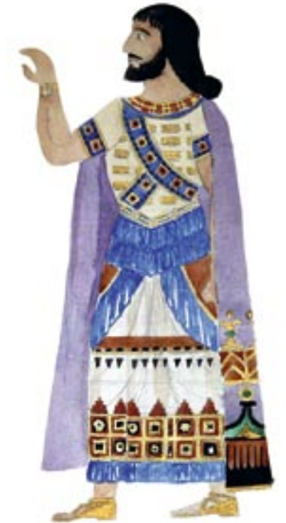
Herodes og Herodias i Richard Strauss' "Salome", 1919