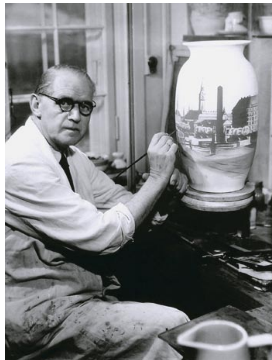
I arbejdsværelset på Den Kgl. Porcelænsfabrik Foto, ca. 1951