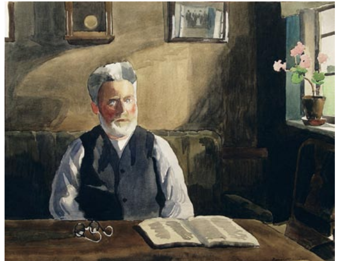
Gammel fisker, Langø ved Fyns Hoved, 1946 Akvarel, 45 x 57 cm

Det er mere end svært at male portræt i akvarel, og han gjorde det næsten aldrig. Billedet stammer fra et længere sommerophold i 1946 hos en fiskerfamilie på Langø.