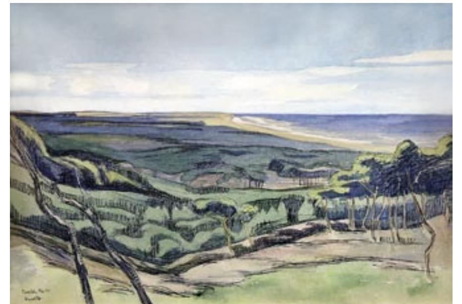
Tisvilde, 1912 Akvarel og tuschpen, 36 x 54 cm