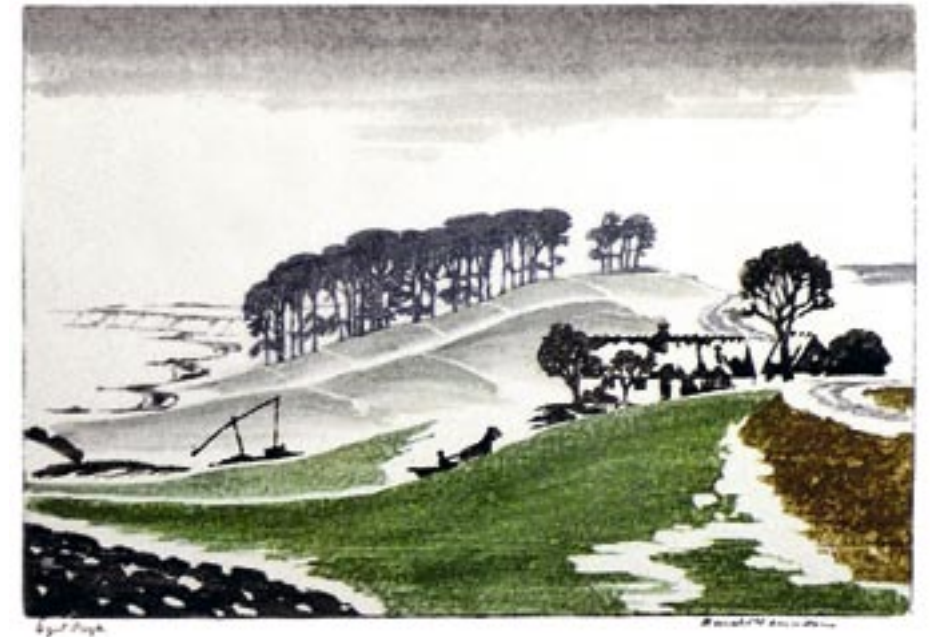
Vippebrønd, Bramsnæsvig, ca. 1935 Farvetræsnit, 29 x 43 cm