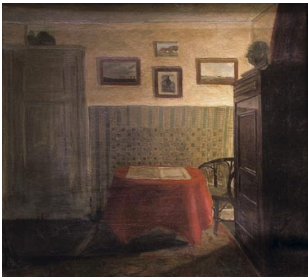
Interiør fra kunstnerens værelse på Østergade i København, ca. 1906

Men i 1908 tog den unge bankmand så alligevel og pludseligt til omgivelsernes overraskelse orlov i et år, og drog til Australien, hvor han arbejdede i sin ældre broders sukkerrørsplantage.