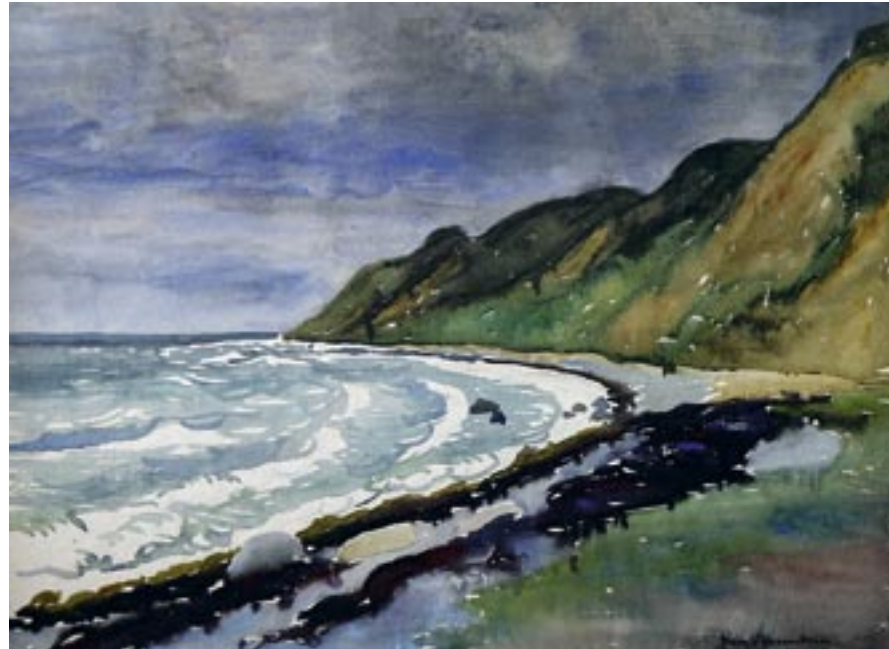
Strand på Røsnæs, 1943 Akvarel, 45 x 62 cm