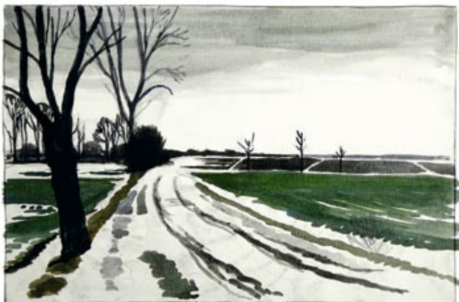
Akvarelskitse, 1945 17,5 x 26 cm

Fra en af skitsebøgerne. Akvarelskitserne er tænkt som forstudier til mulige træsnit. De er hurtigt nedkastet, men virker alligevel forbavsende færdige og helstøbte.