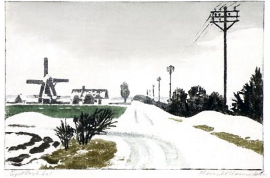
Vinterlandskab med mølle Farvetræsnit, 18 x 26 cm