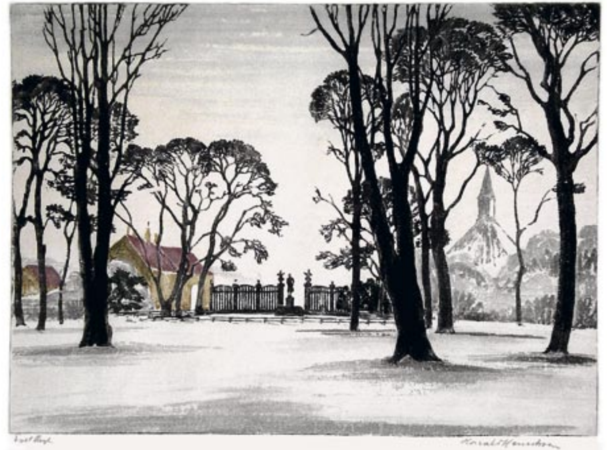
Plænen i Frederiksberg Have, sne, 1927