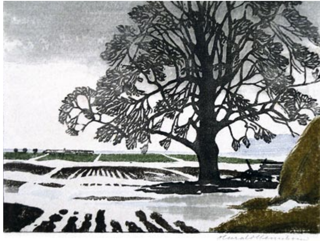
Træ, marker i sne Farvetræsnit, 20 x 28 cm