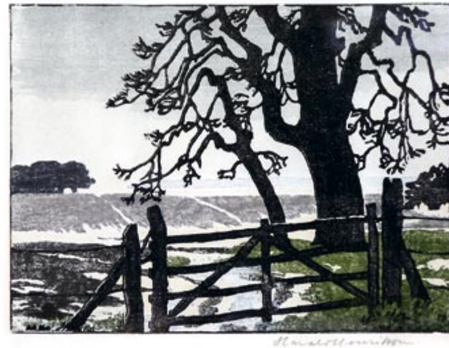
Fra Skejten. Farvetræsnit, 15 x 20 cm