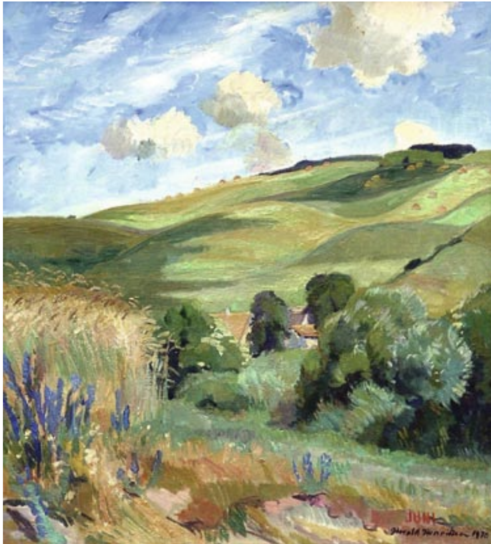
Bjergene ved Vejrhøj, 1930 Olie på lærred, 60 x 54 cm