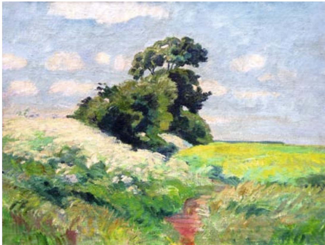
Sommerdag i Bjergene, ca. 1950

”Naturen, det billige skidt” sagde Poul Henningsen engang. Det var i byerne fremskridtet sejrede. I hvert fald ikke på landet, der til gengæld blev omfattet af en stadig større nostalgisk længsel, jo mere man klumpede sig sammen i byerne. Så måtte man jo ud i sommerlandet, når man var en bybo, der trængte til ro og ferie fra hverdagen. De moderne kunne se naturen som en slags sentimentalt sætstykke, noget man mest brugte om sommeren, inden man skulle tilbage til det virkelige liv med dets naturlige travlhed.