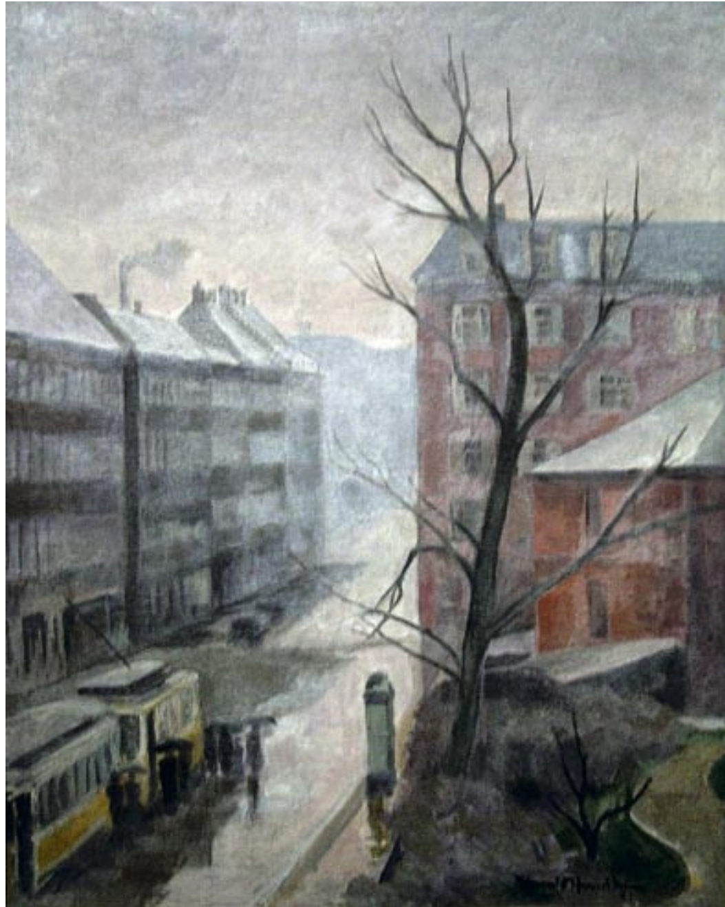
Fasanvej, regn, 1951 Olie på lærred, 58 x 46 cm