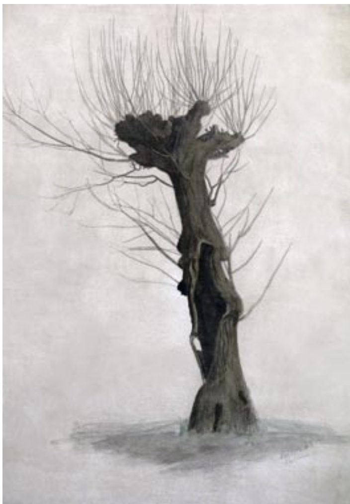
Stynet træ, 1906 Studietegning, 54 x 39 cm