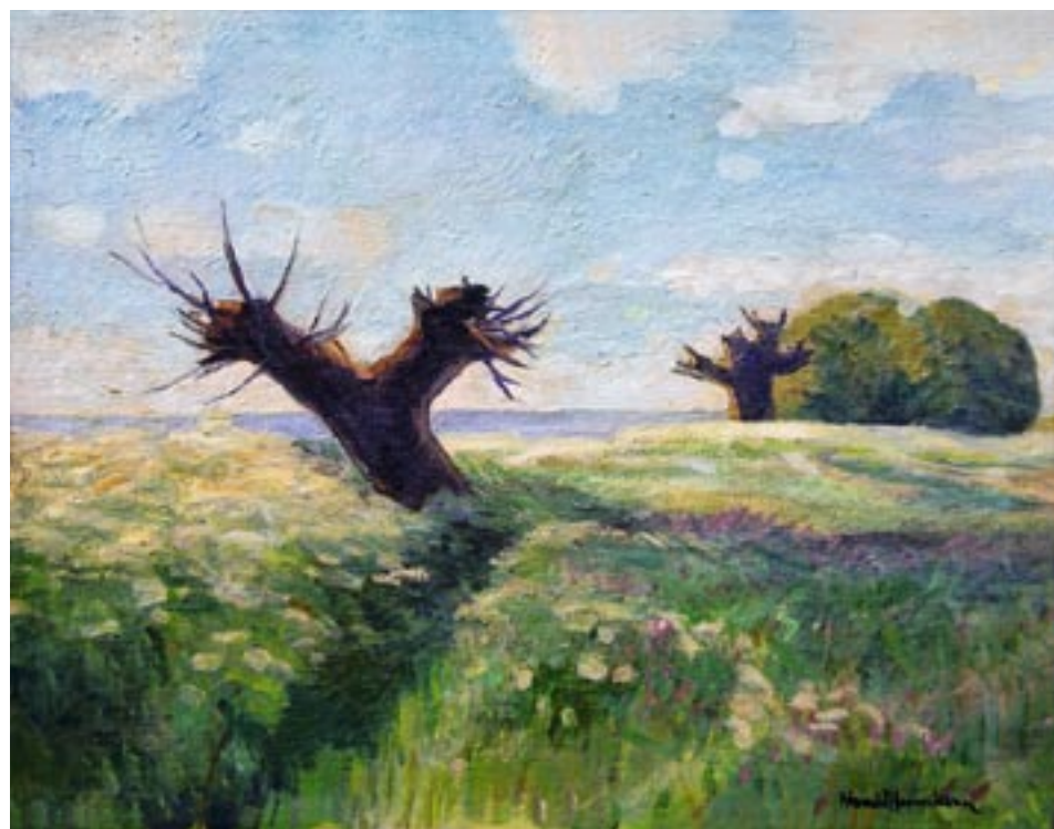
Sommereng, ca. 1950 Olie på lærred, 50 x 64 cm