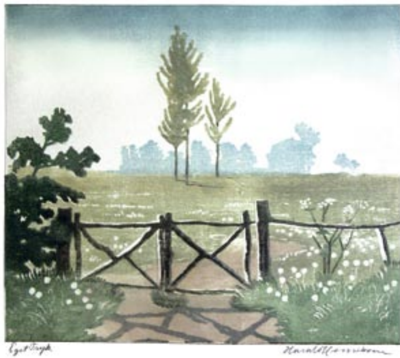
Moseder i maj, 1949 Farvetræsnit, 28 x 32 cm