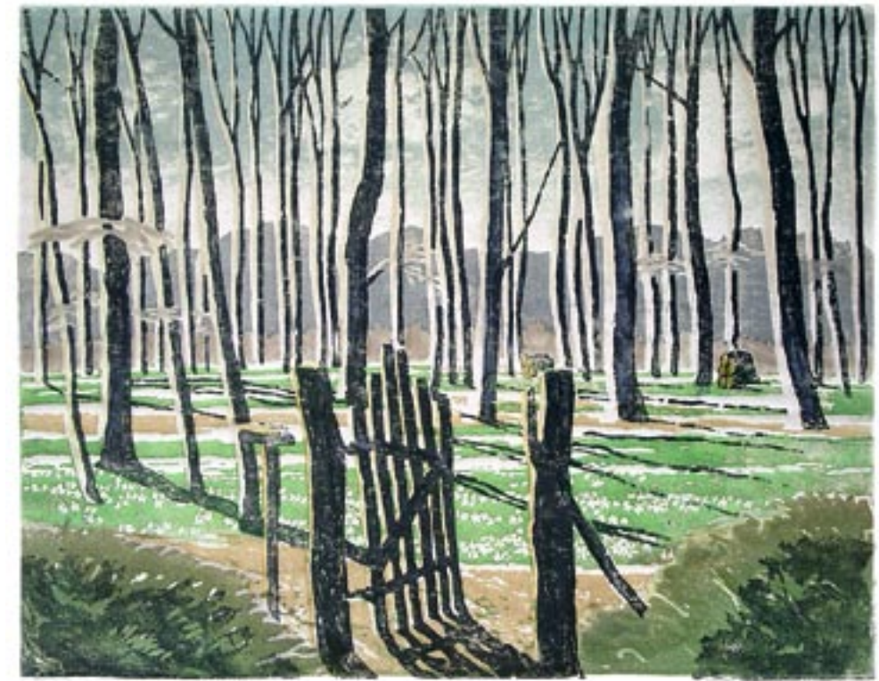
Bøgeskov med anemoner, 1946 Farvetræsnit, 46 x 58 cm

Det danske landskab ændrede sig radikalt op gennem 1950'erne og i årtierne derefter. I år 1900 var Danmark overvejende et landbrugsland. I 1950 arbejdede der stadig flere i landbruget end i industrien. I 1957 vendte udviklingen, så nu var der flere i industrien end i landbruget. Den store indvandring fra land til by slog igennem. Og i landbruget ændrede en omfattende mekanisering hele landbrugets måde at fungere på. Op gennem 1950'erne blev antallet af traktorer større end antallet af heste. Den grå traktor ved navn Ferguson erstattede den brune hest Lotte. En af de store tabere i den udvikling var det danske landskab. Det mindskedes hele tiden, og naturen har siden været på tilbagetog. Det betød også – set med kunstneriske briller – at naturen som identitetsskabende faktor blev stadig mindre. Dette slog efterhånden også igennem i malerkunsten.