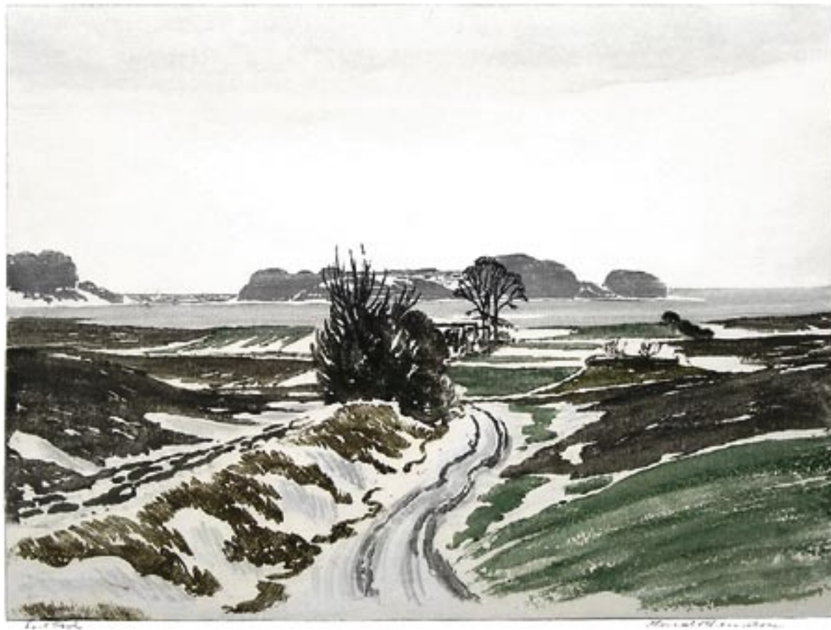
Vinterlandskab, Bramsnæsvig 1935 Farvetræsnit, 38 x 50 cm