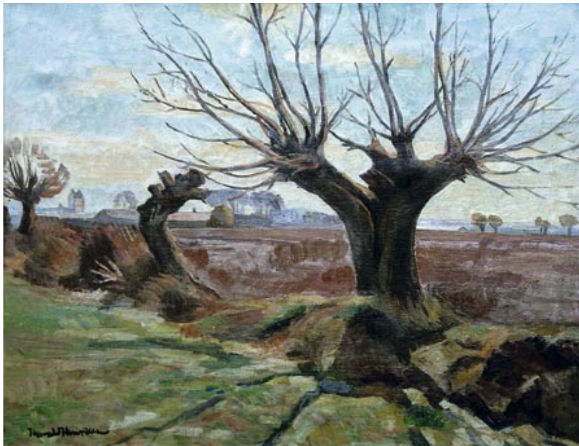
Et gærde, forår 1954 Olie på lærred, 54 x 70 cm