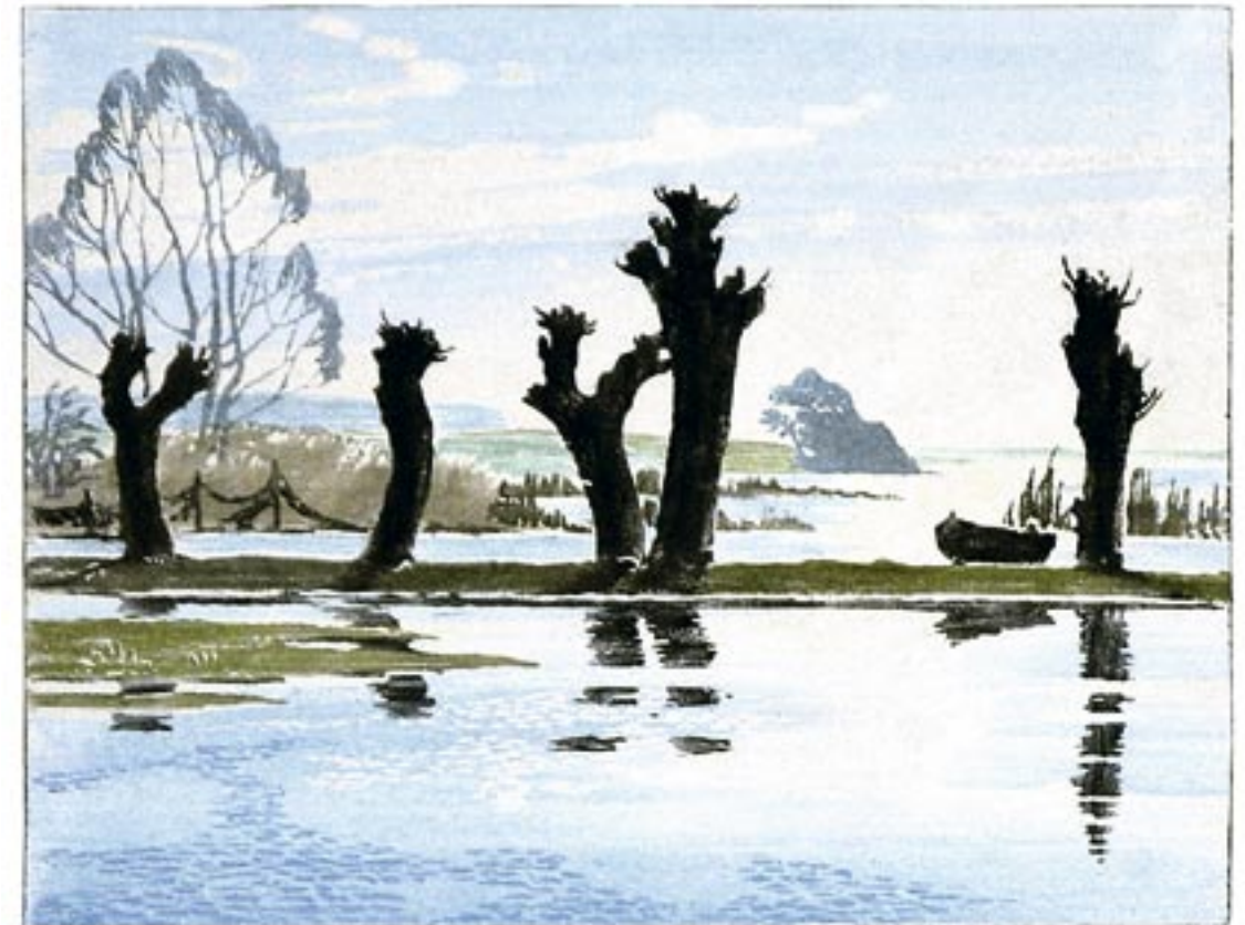
Fjordlandskab, forårslys Farvetræsnit, 30 x 40 cm