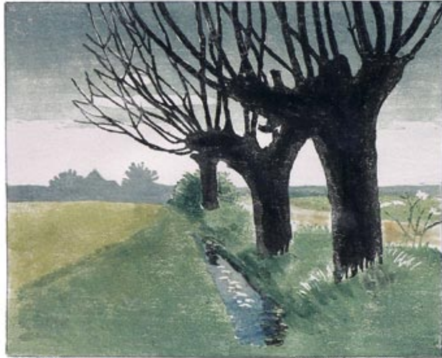
Eget Træg Harald Henriksen Stynede popler, 1949 Farvetræsrit, 25 x 30 cm