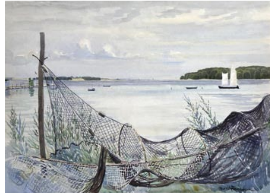
Åleruse, Thurø, ca. 1932 Akvarel, 48 x 64 cm

Københavns vestegn var i 1940-50erne stadig bondeland med flade marker, gårde og små landsbysamfund. Det var overkommeligt at cykle herud – eller tage toget, som her til Brøndbyøster.