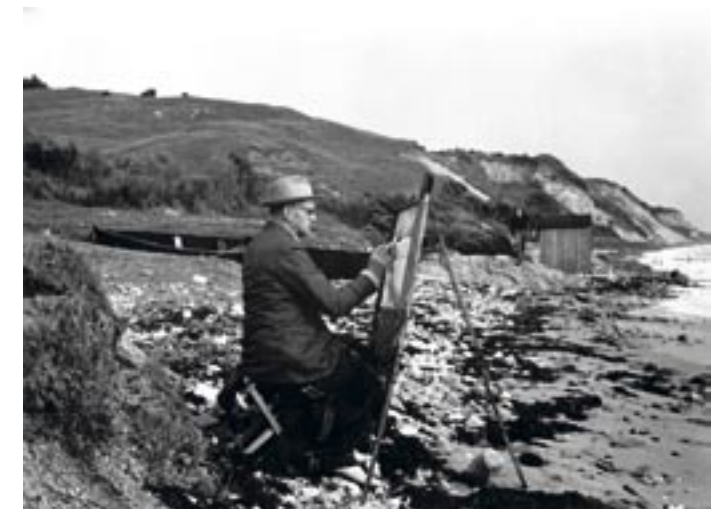
På Røsnæs sydstrand Foto, 1948