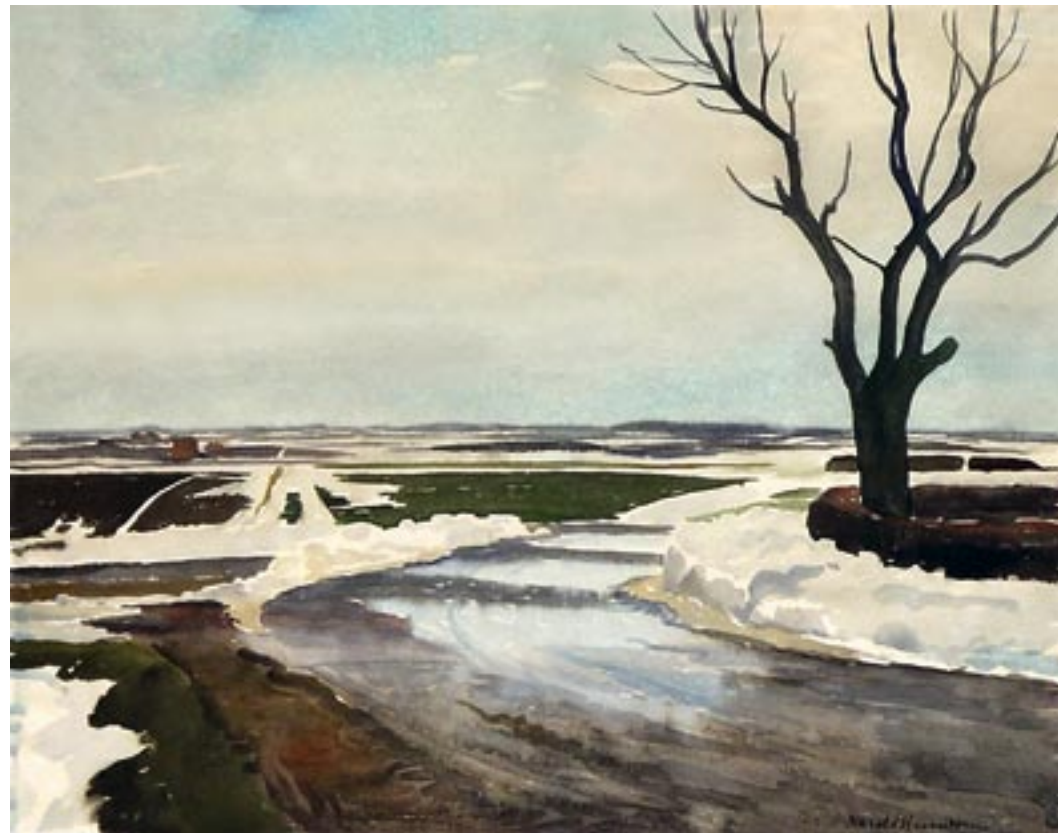
Vejsving, tøjbrud, ca. 1952 Akvarel, 46 x 60 cm

Det danske landskab ændrede sig radikalt op gennem 1950'erne og i årtierne derefter. I år 1900 var Danmark overvejende et landbrugsland. I 1950 arbejdede der stadig flere i landbruget end i industrien. I 1957 vendte udviklingen, så nu var der flere i industrien end i landbruget. Den store indvandring fra land til by slog igennem. Og i landbruget ændrede en omfattende mekanisering hele landbrugets måde at fungere på. Op gennem 1950'erne blev antallet af traktorer større end antallet af heste. Den grå traktor ved navn Ferguson erstattede den brune hest Lotte. En af de store tabere i den udvikling var det danske landskab. Det mindskedes hele tiden, og naturen har siden været på tilbagetog. Det betød også – set med kunstneriske briller – at naturen som identitetsskabende faktor blev stadig mindre. Dette slog efterhånden også igennem i malerkunsten.