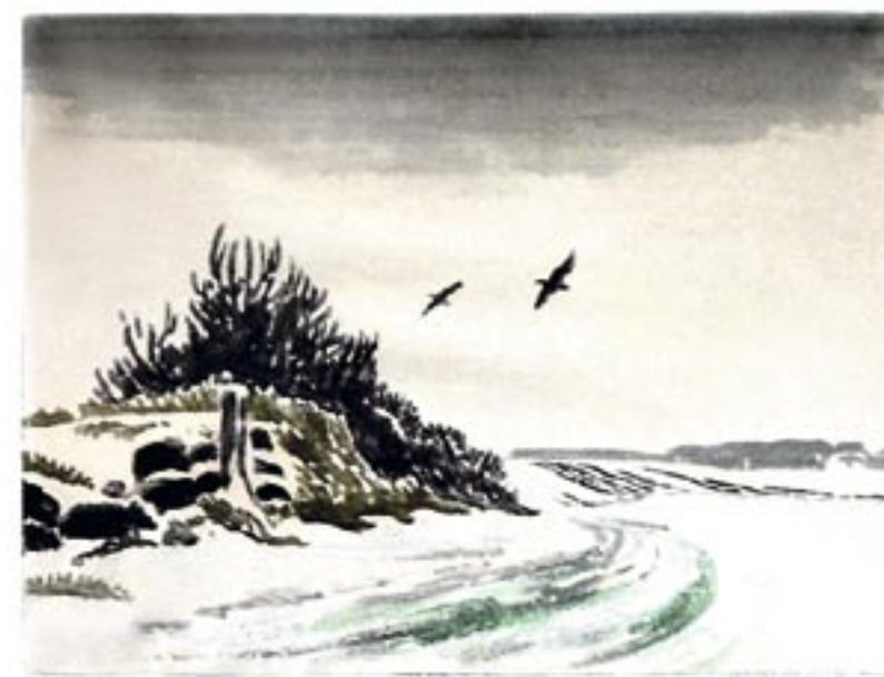
Busk og krager, ca. 1930 Farvetræsnit, 37 x 50 cm