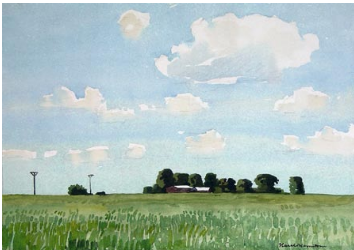
Juniluft, 1960 Akwarel, 33 x 47 cm