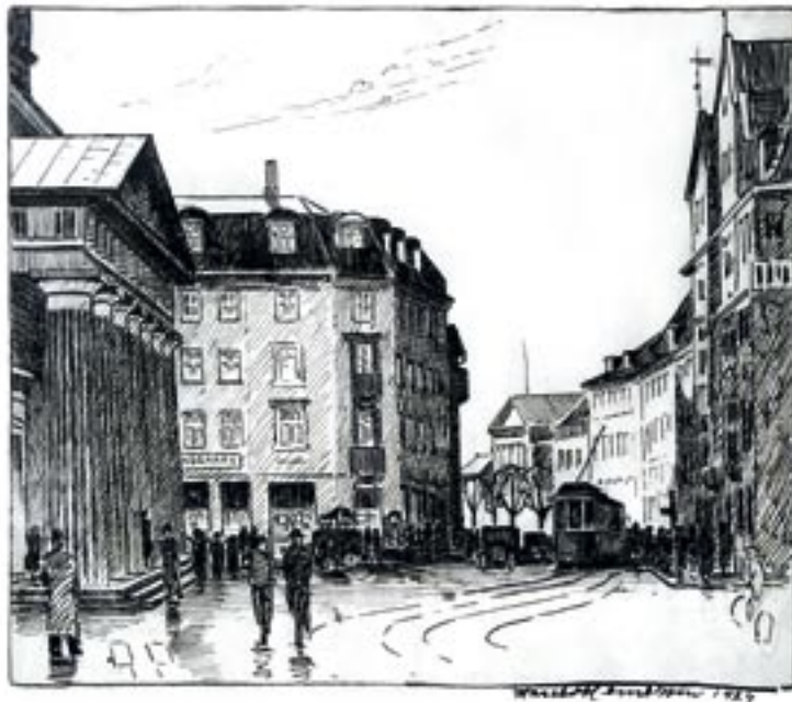
Nørregade ved Domkirken, 1924 Tuschtegning 22 x 26 cm