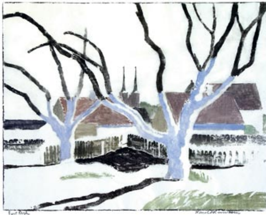
Tidlig forårssol, Roskilde, 1927 Farvetræsnit, 34 x 44 cm