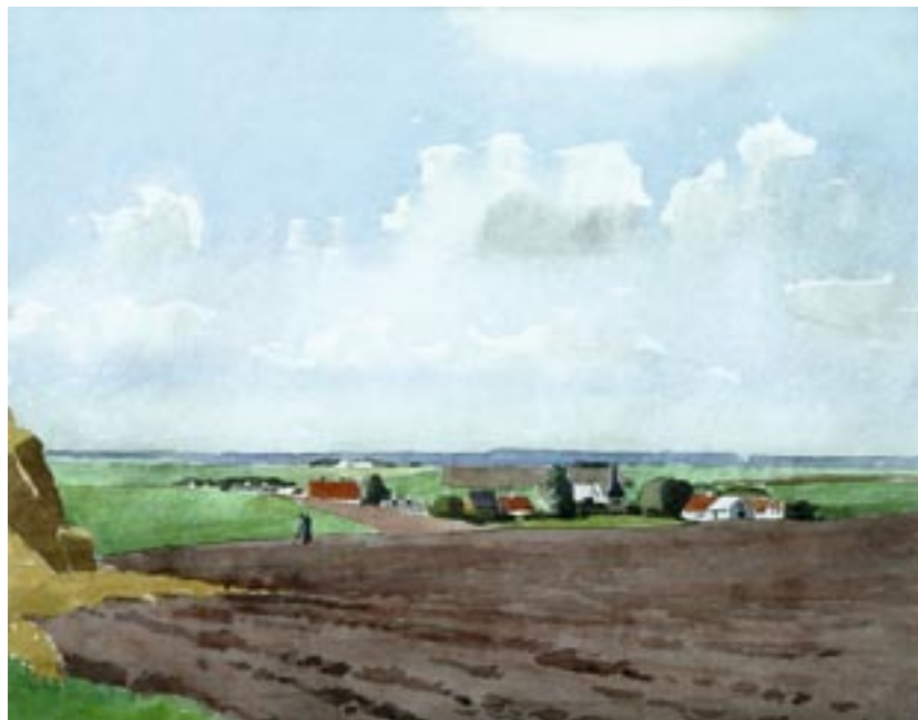
Sommerlandskab med roehakker Akvarel, 43 x 55 cm