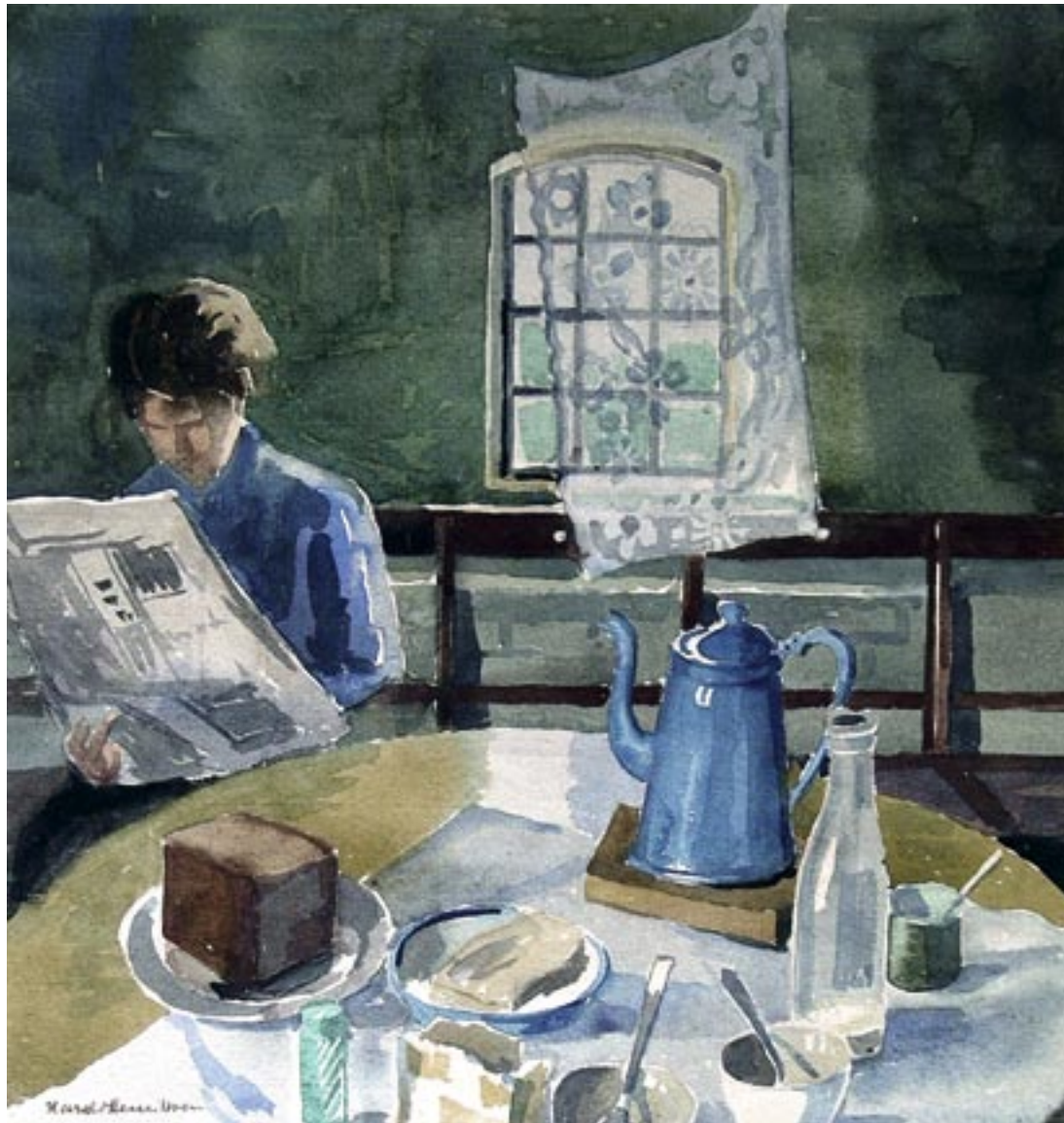
Morgenbord, ca. 1950 Akvarel, 32 x 31 cm