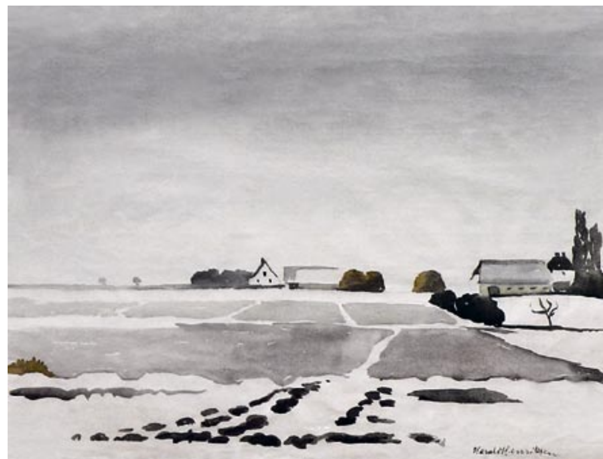
Vinterlandskab, Brøndbyøster, ca. 1955

Et af de sidste billeder, fra januar eller februar. Akvarel, 46 x 59 cm