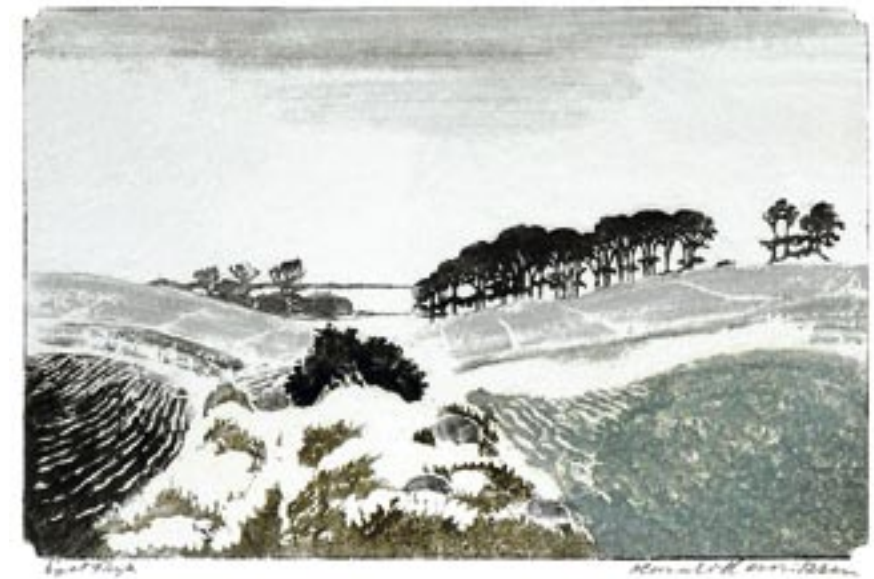
Ved Bramsnæsvig, vinter 1935

”...hvad det grønne i Havremarken angår, tror jeg at ingen Farve i sig selv har nogen Værdi, – den får det først gennem hvad den er sat ved siden af, ...er nogen Ting i det hele taget noget i sig selv eller bliver de det først i Forhold til noget andet?...”.