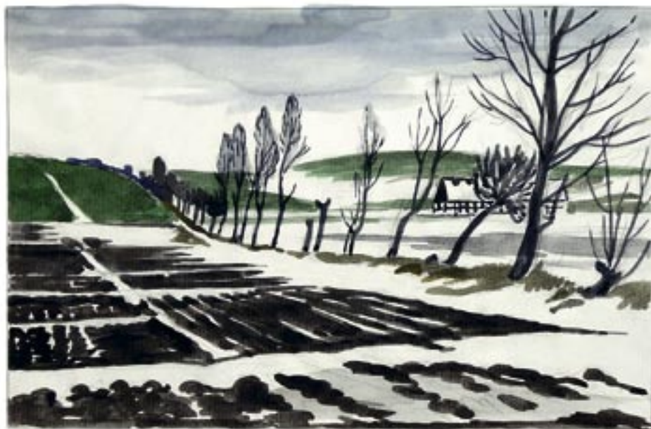
Akvarelskitse, 1945 17,5 x 26 cm