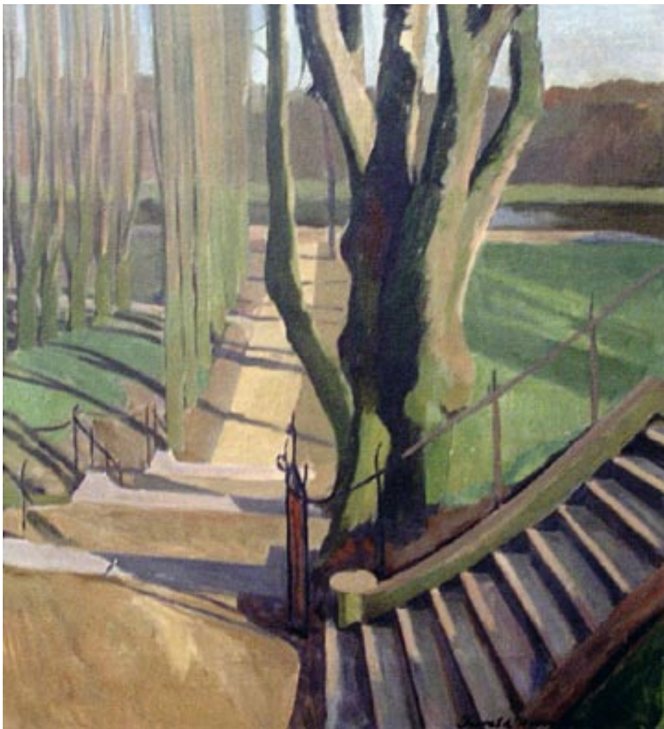
Fra Frederiksberg Have, ca. 1931