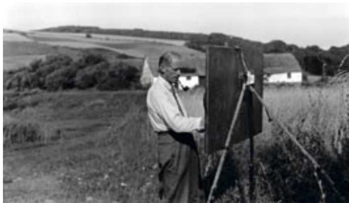
Omtrent på dette sted blev billedet på side 34 malet.