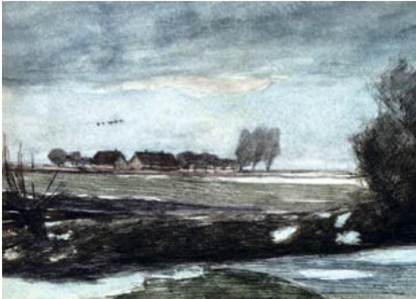
Fynsk landskab, 1906 Akvarel og tuschpen, 23 x 31 cm