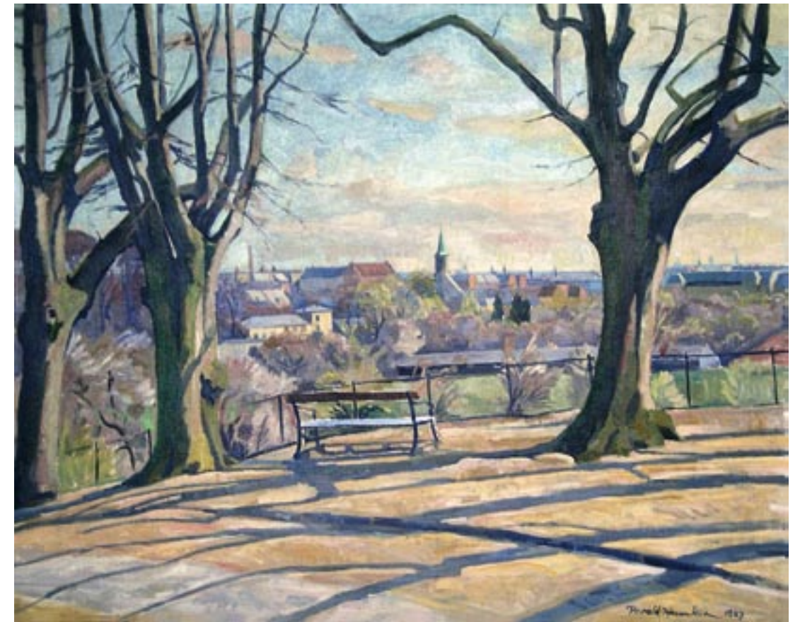
Tidligt forår på Frederiksberg bakke, 1927 Olie på lærred, 77 x 99 cm