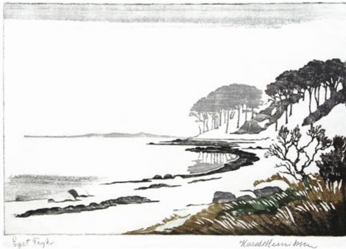
Vinter ved en kyst, Bramsnæsvig, 1924