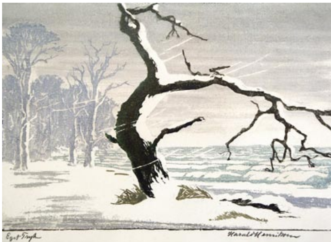
Snestorm, Brandsø, 1925 Farvetræsnit, 30 x 43 cm