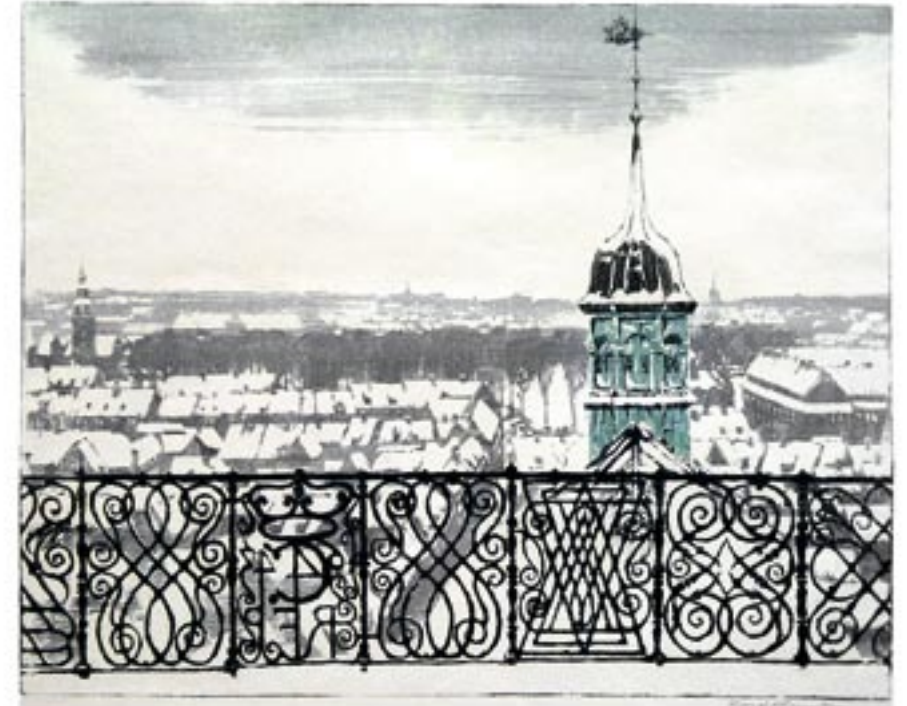
Udsigt fra Rundetårn, 1931 Farvetræsnit, 42 x 52 cm

Johannes. V. Jensen i Myten ”Danmarks Natur”