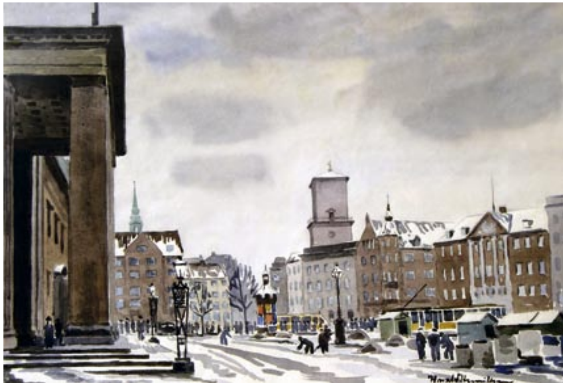
Nytorv og Gammeltorv, ca. 1938 Akwarel, 35 x 49 cm