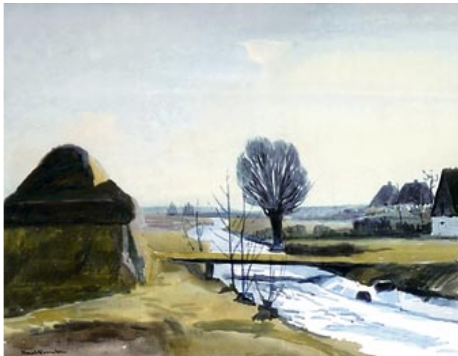
Tidligt forår ved en å, ca. 1945 Akvarel, 44 x 57 cm