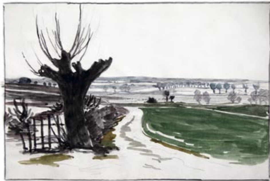
Akvarelskitse, 1947 20 x 31 cm