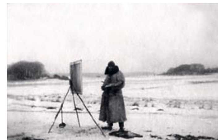
En sten i en snor kunne være nødvendigt for at forhindre staffeli og bræt i at flyve bort i vinden.

Perfektionistisk som han var, skulle helhed, komposition og detalje være helt i orden, før han godkendte sit billede. Ofte kom han hjem med to akvareller efter en dag. Og ikke sjældent blev det ene eller begge kasseret, hvis han ikke var tilfreds. Især himlen, fandt han, var svær at fastholde. Den skulle indfanges på den helt rette skrøbelige og sitrende præcise måde.