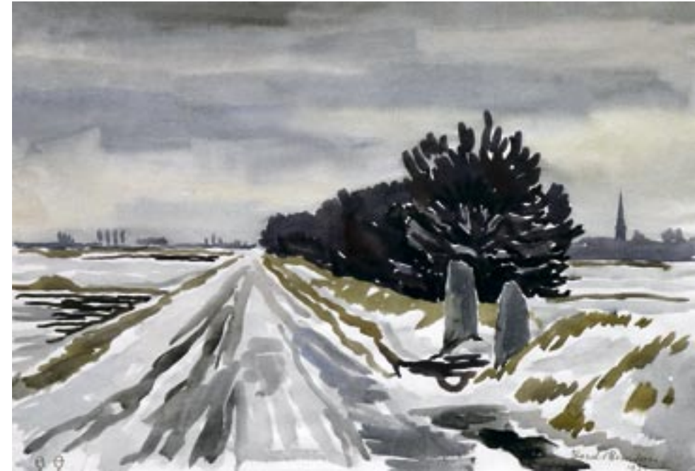
Vinterlandskab, 1937 Akvarel, 26 x 39 cm