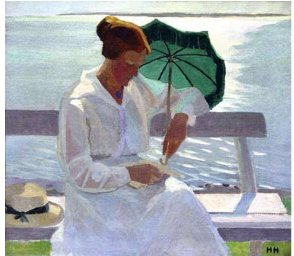
Karen ved Nexeløbugten, 1917 Olie på lærred, 62 x 69 cm