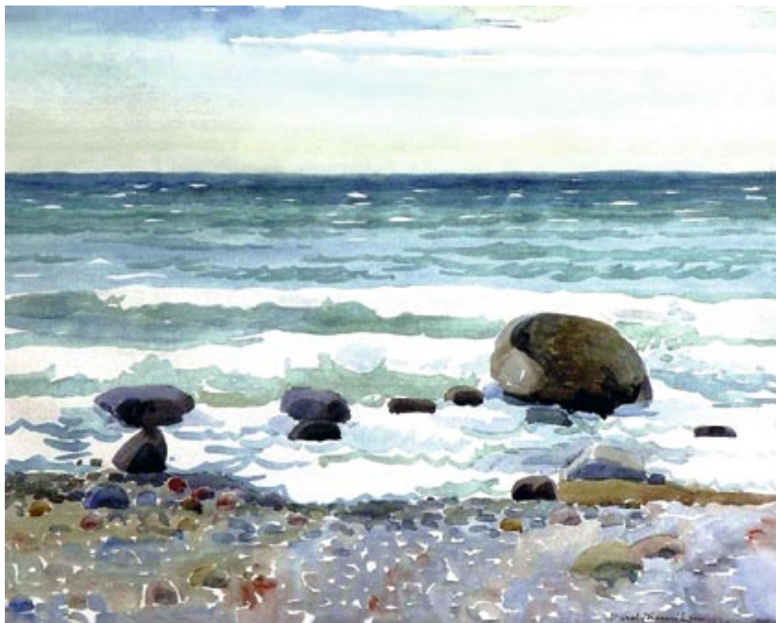
Strand, 1949 Akwarel, 43 x 55 cm