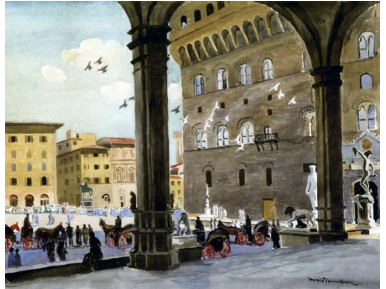
Palazzo Vecchio, Firenze, 1954 Akvarel, 47 x 62 cm