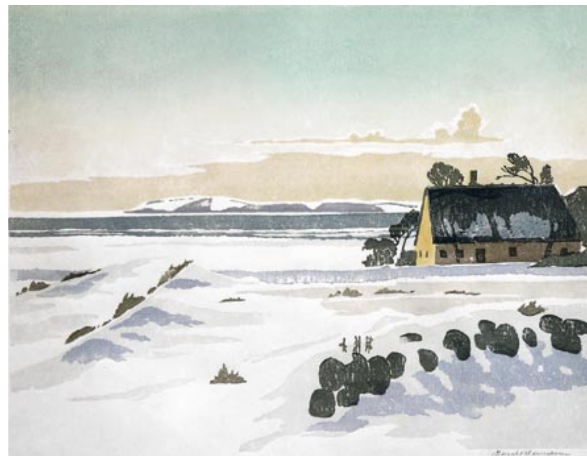
Gudruns hus, Bjergene, ca. 1948 Farvetræsnit, 43 x 57 cm