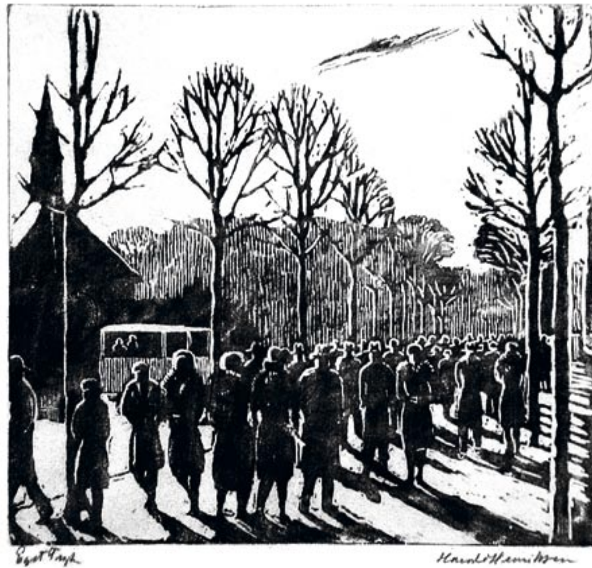
Frederiksberg Allé, ca. 1930 Træsnit, 22 x 23 cm