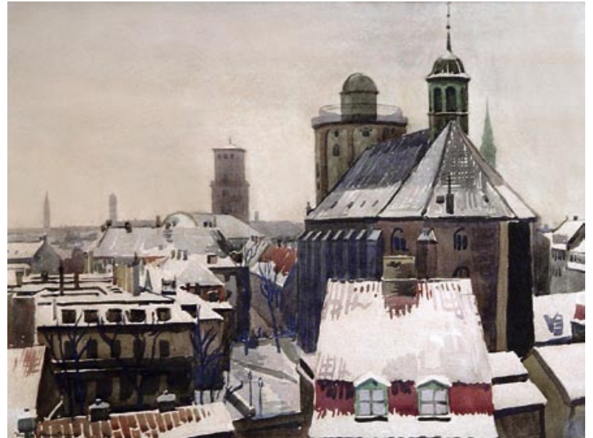
Trinitatis Kirke, vinter 1940 Akvarel, 45 x 59 cm