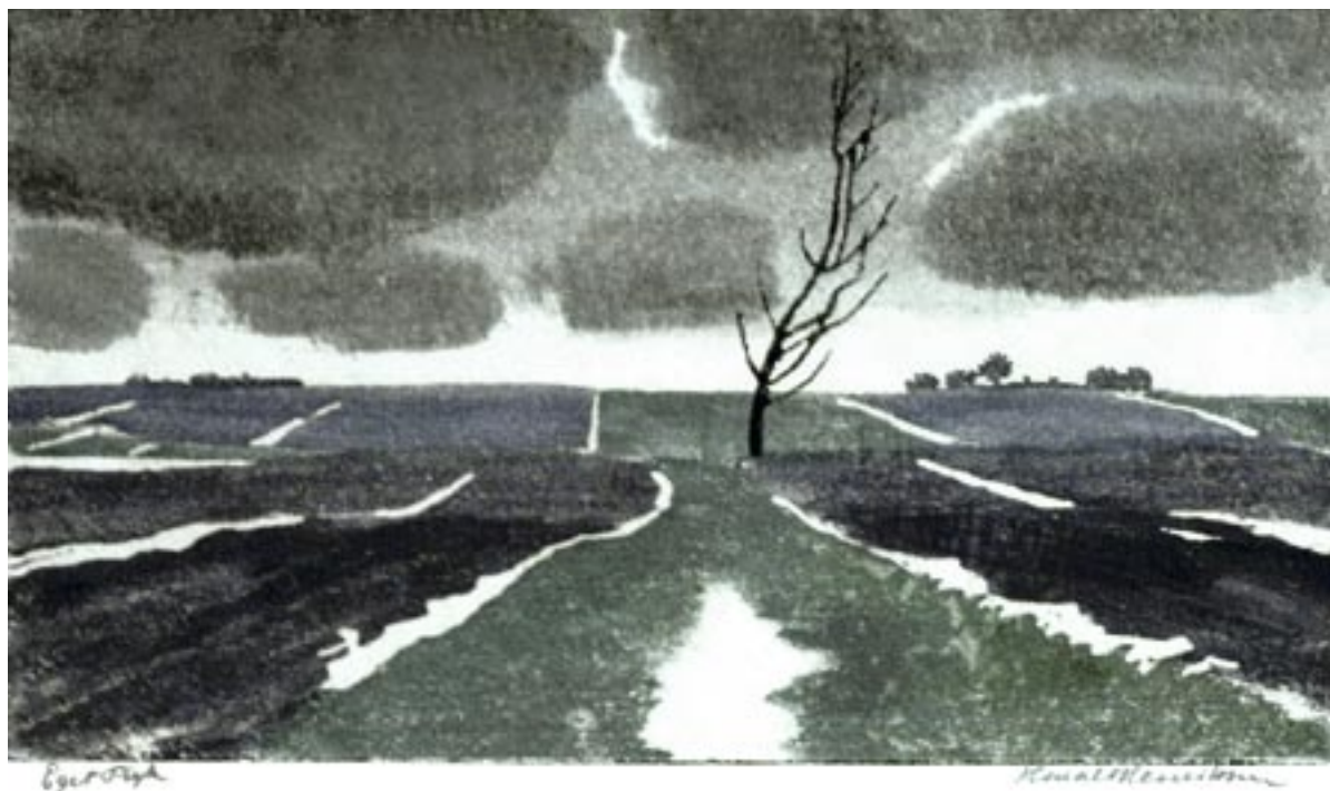
Marker, tøsne Farvetræsnit, 20 x 34 cm