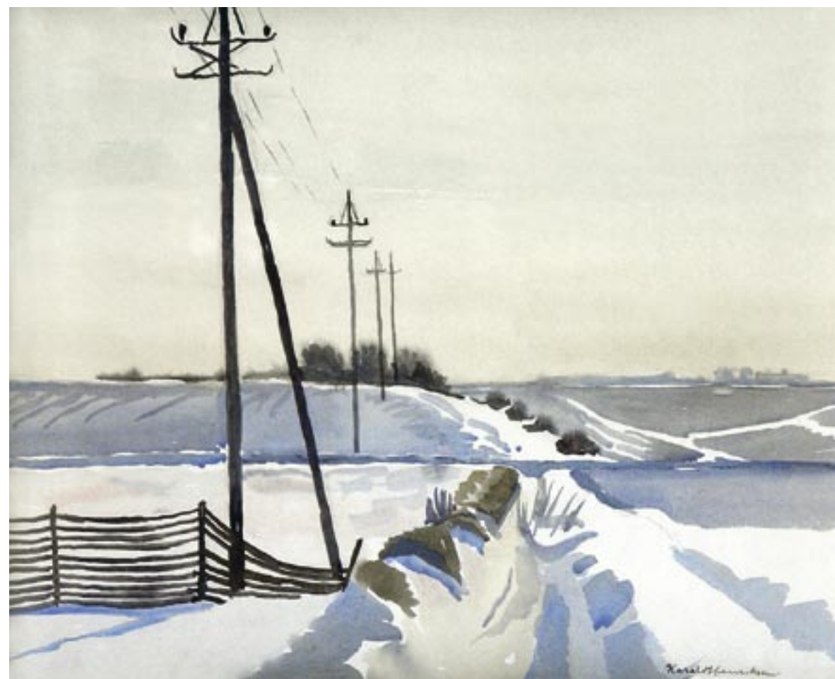
Snelandskab, ca. 1950 Akvarel, 37 x 46 cm

akkurate gengivelser af naturen nord for Storkøbenhavn. Nordsjælland havde (og har) sine steder. Asserbo. Fredensborg. Tisvildeleje. Området omkring Gurre. Og længere over mod Arresø og Roskilde fjord. Ja, overalt i Danmark var der gode steder for malere, der ville skildre naturen.