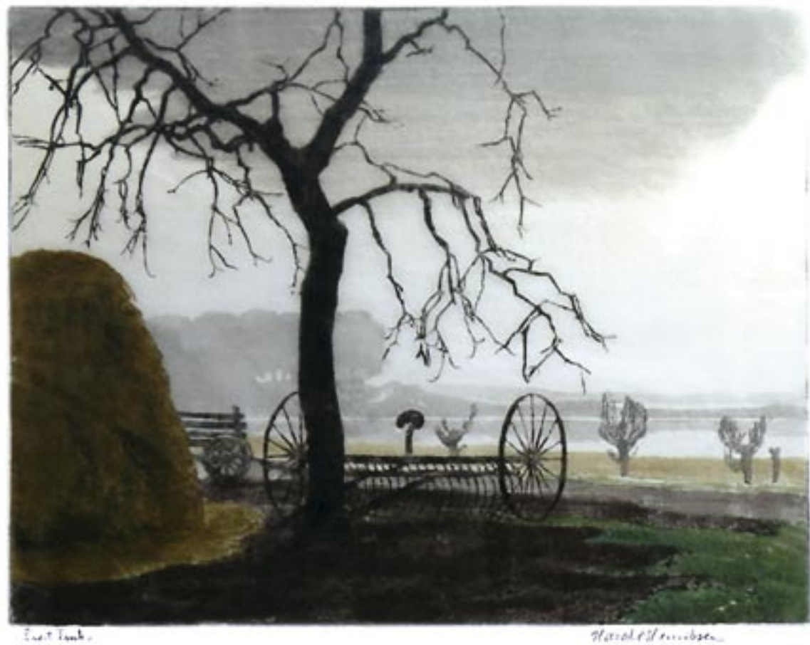
Hesterive November, Bramsnæsvig, 1926 Farvetræsnit, 23 x 27 cm