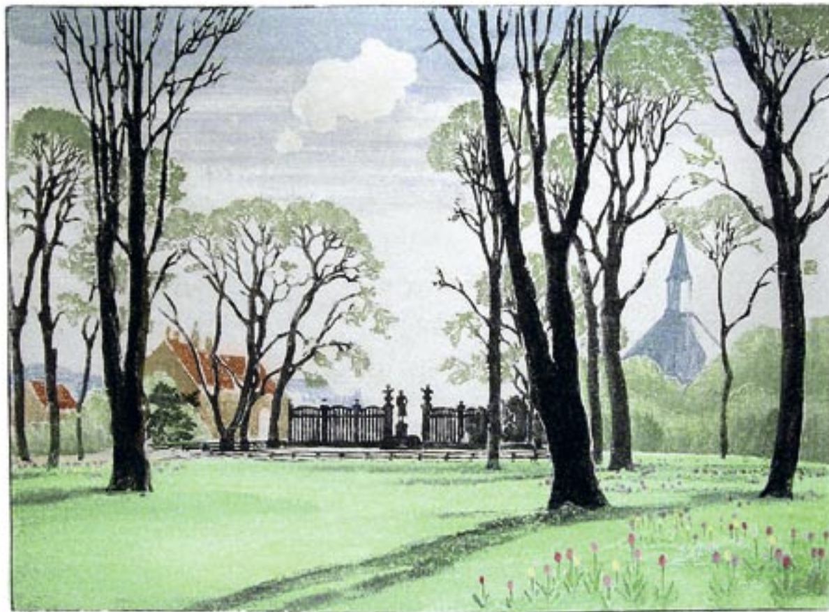
Plænen i Frederiksberg Have, forår 1926

Frederiksberg Have rummede med sin historiske atmosfære mange motiver og øvede stor tiltrækning. Her den store plæne på to forskellige årstider.