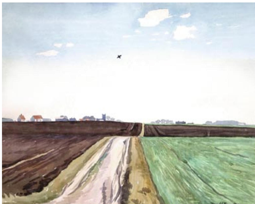
Forårsdag ved Vallensbæk, ca. 1943