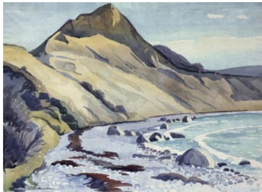
Klint, Røsnæs, 1949 Akvarel, 46 x 62 cm