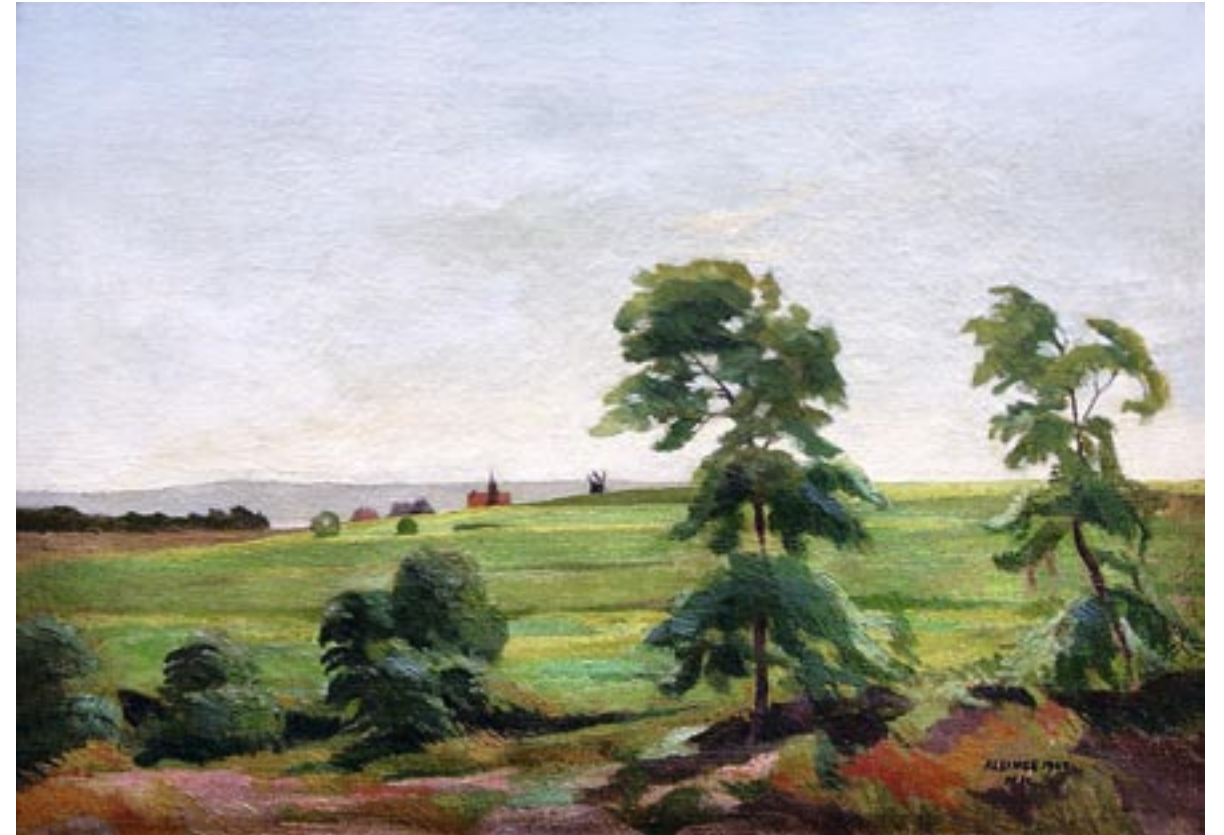
Allinge, 1923 Olie på lærred, 51 x 72 cm