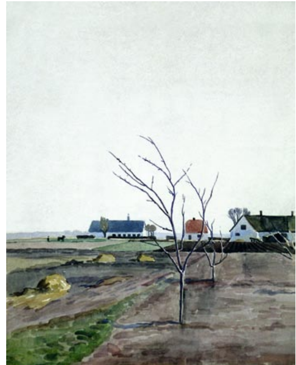
Landskab med pløjemand