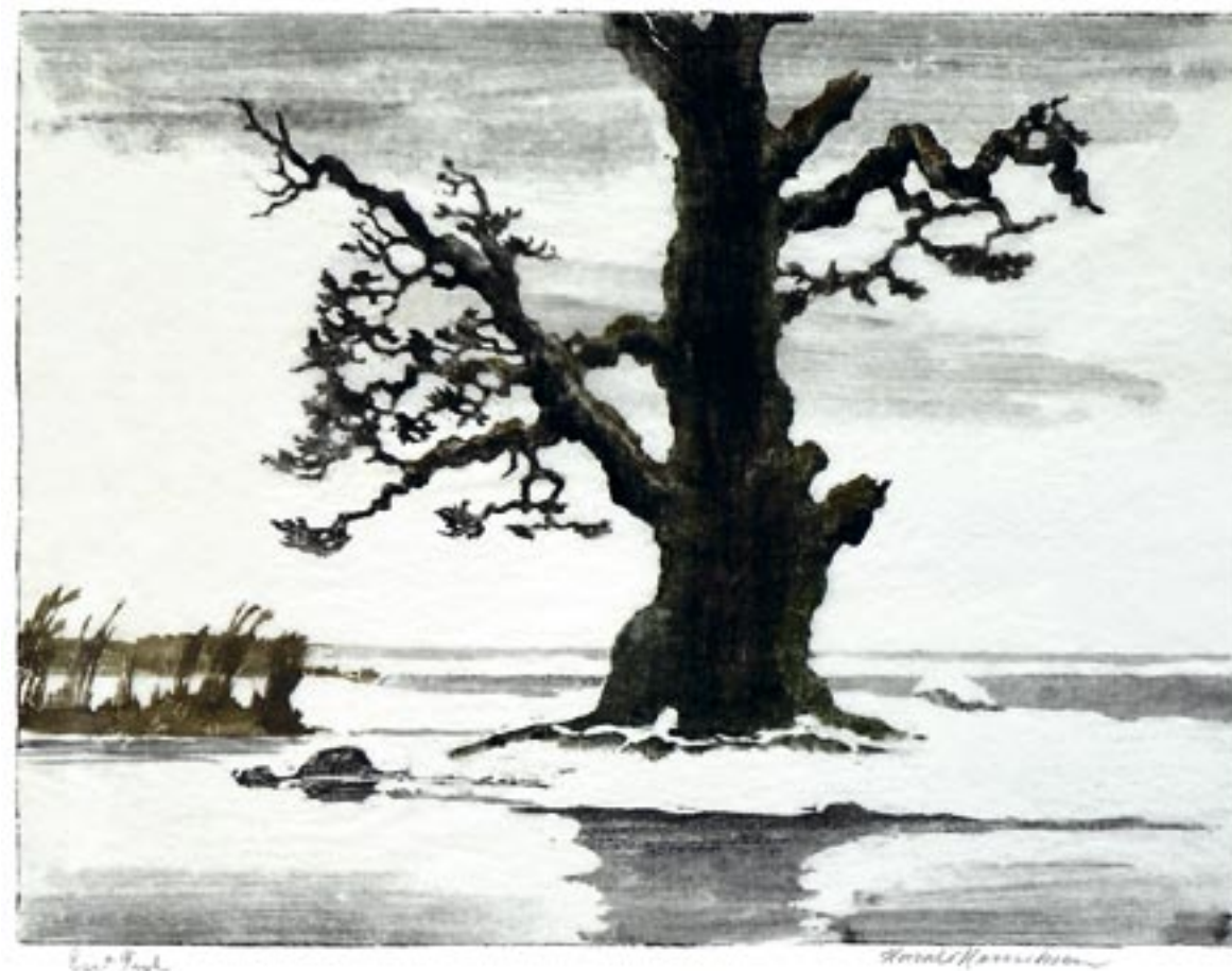
Eg ved strand, Skejten, vinter ca. 1930 Farvetræsnit, 35 x 45 cm