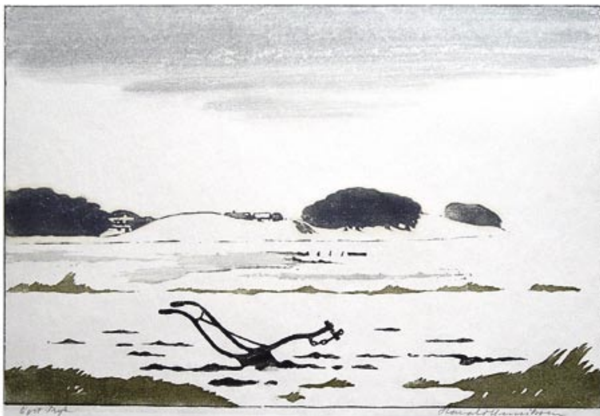
Plov i sne, Bramsnæsvig 1924 Farvetræsnit, 30 x 44 cm