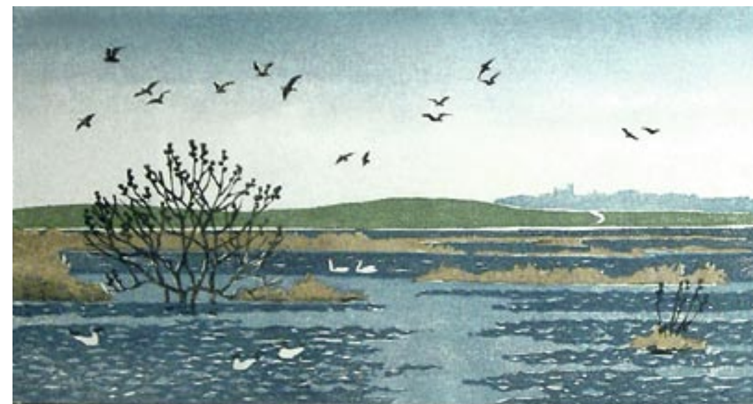
Brønshøj mose, 1949 Træsnit, 21 x 38 cm