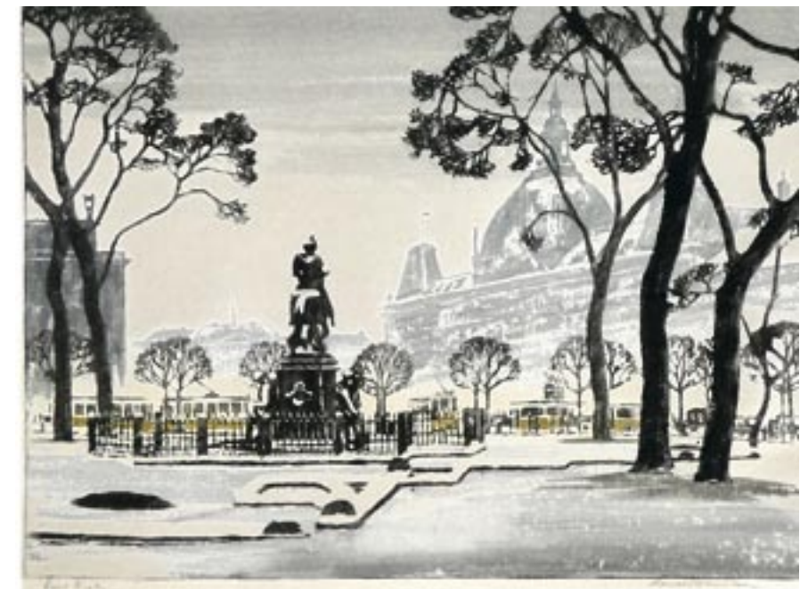
Kongens Nytorv, 1928 Farvetræsnit, 38 x 51 cm