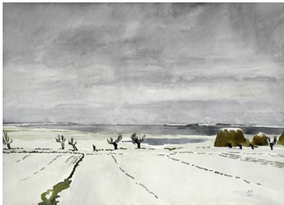
Nekseløbugten, vinter 1919