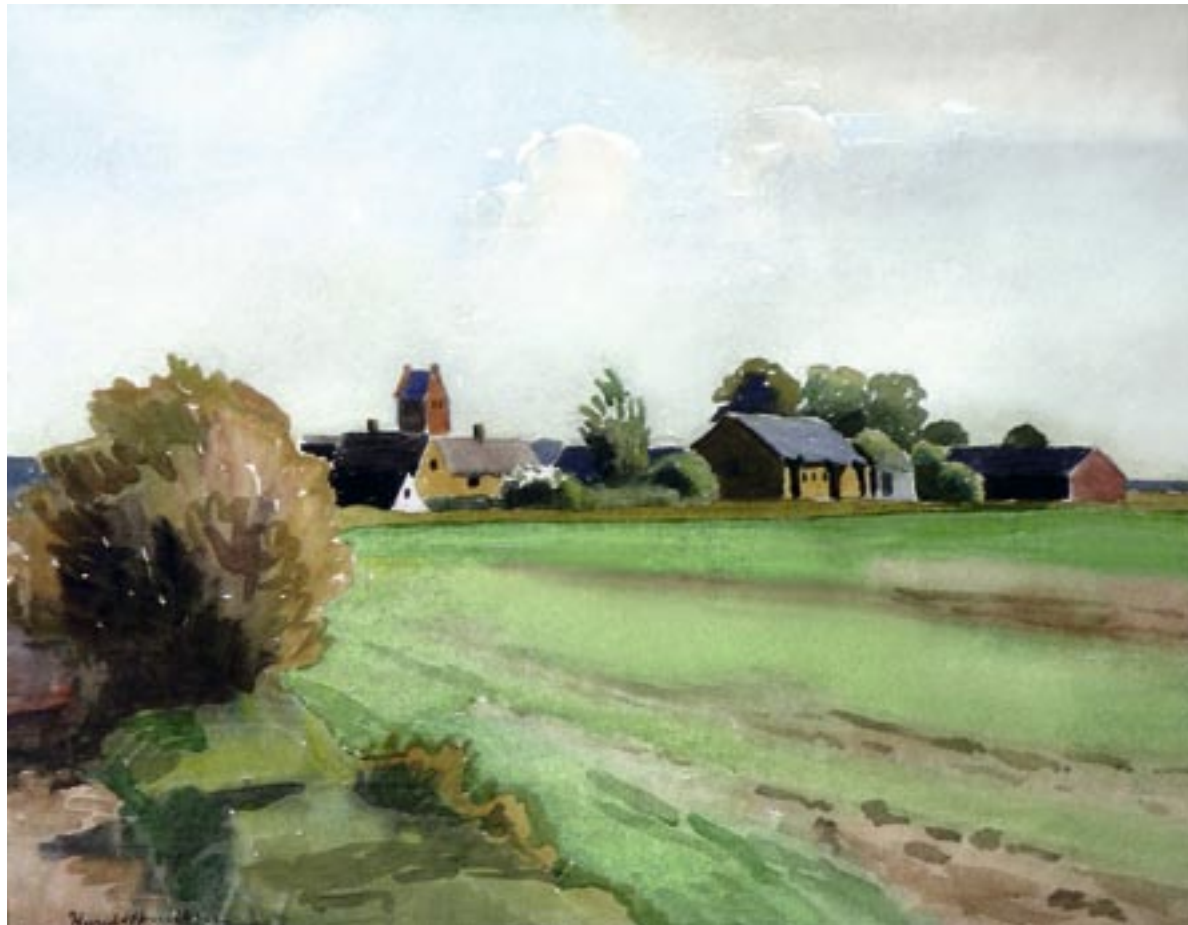
Fra Brøndbyøster, ca. 1946