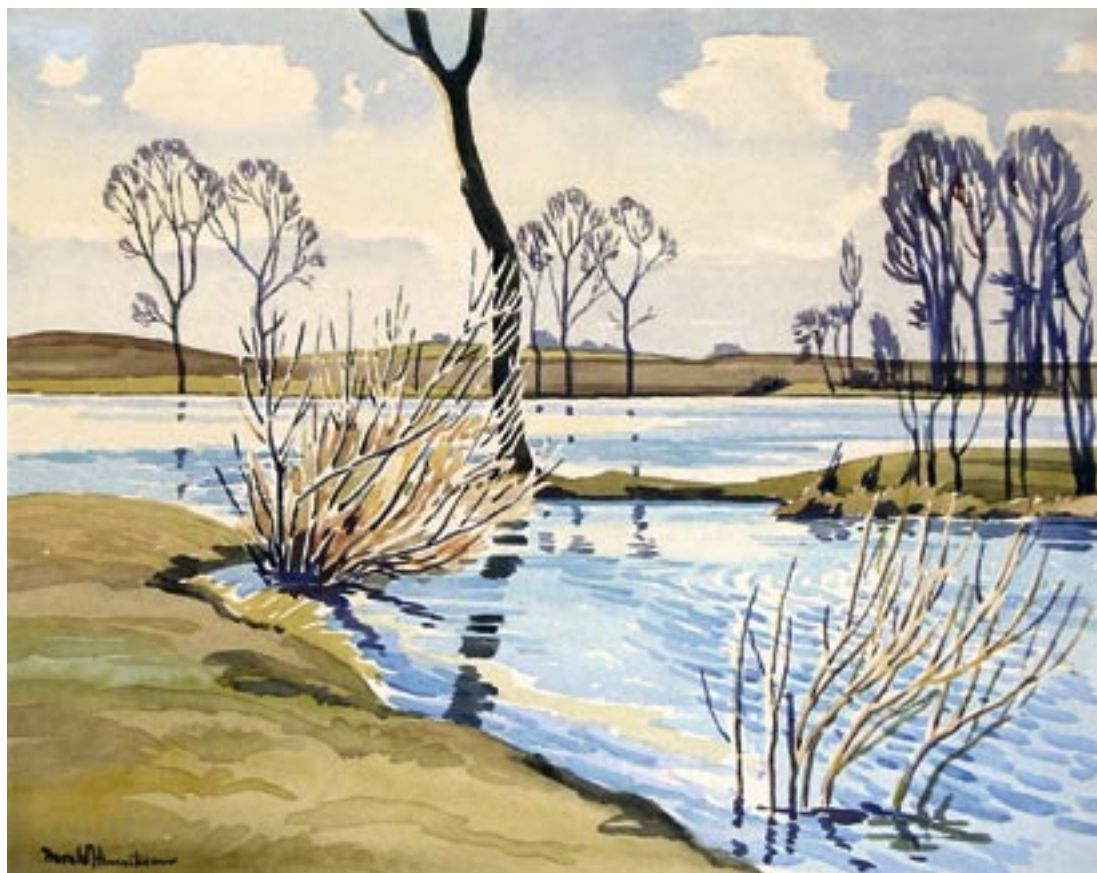
Sjællandsk sø, tidligt forår Akvarel, 33 x 41 cm