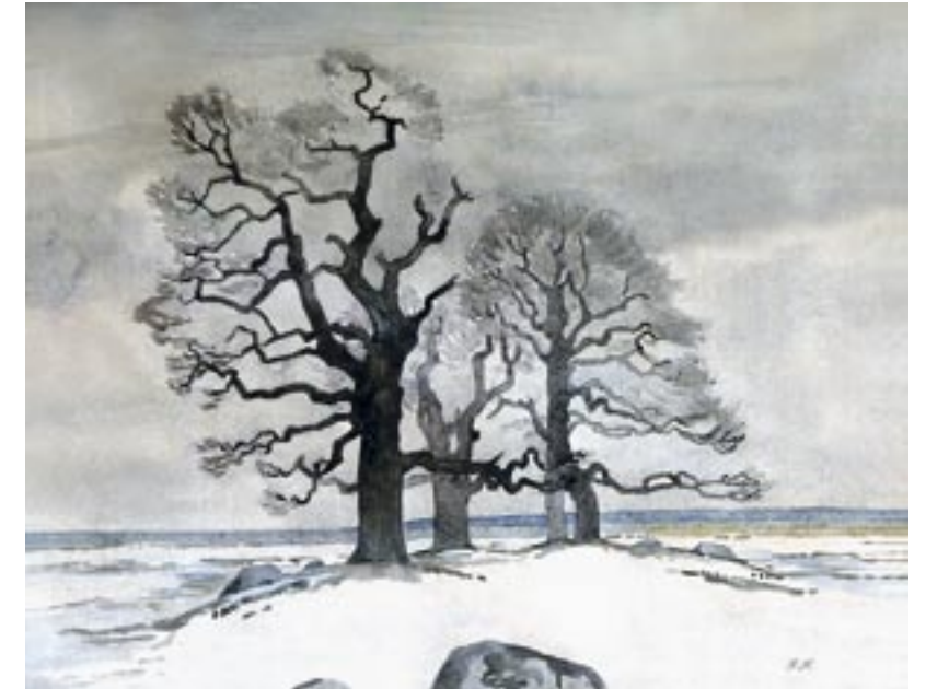
Egetræer, Skejten, 1920 Akvarel, 41 x 52 cm