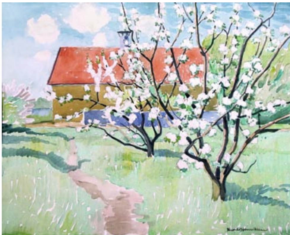
Blomstrende frugttræer, ca. 1933