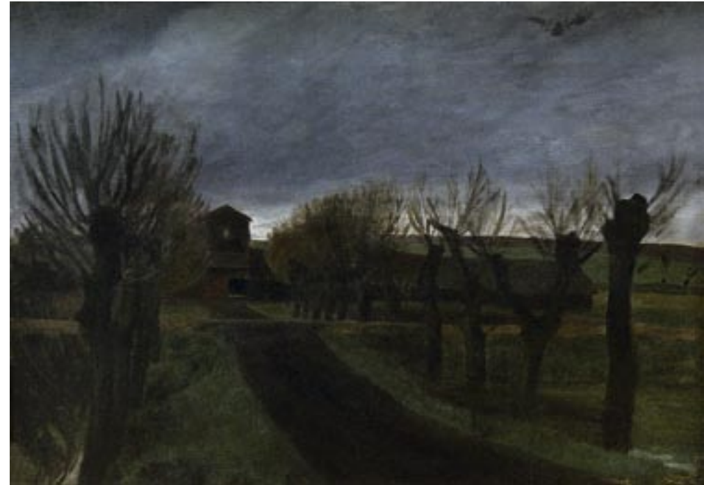
Tusmørke ved Lersøen, ca. 1906 Olie på lærred, 41 x 58 cm