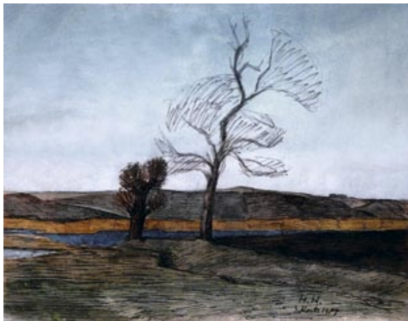
Landskab, 1907 Akvarel og tuschpen, 36 x 46 cm