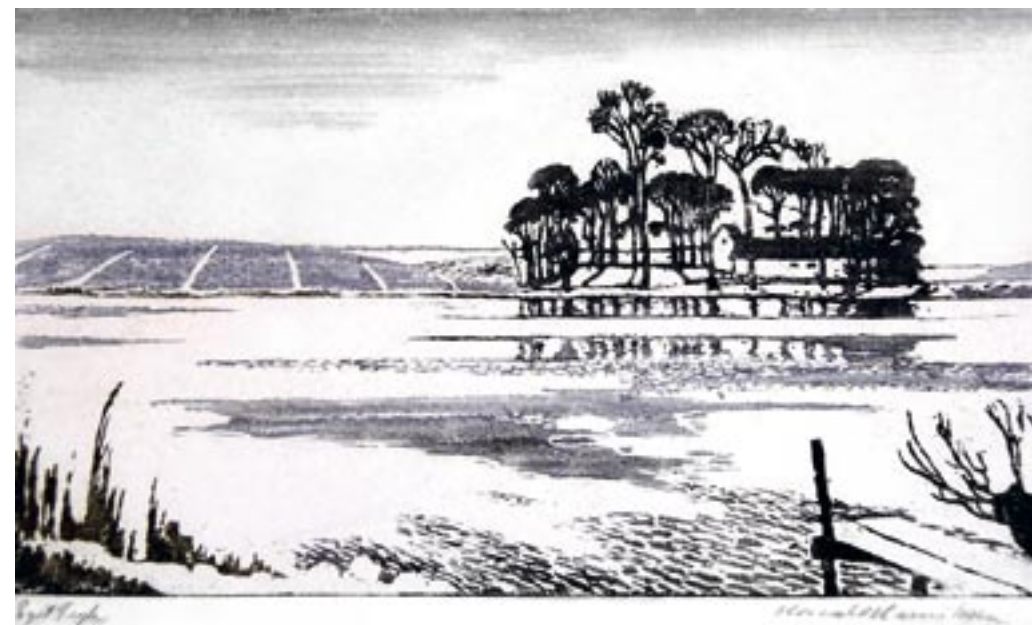
Brønshøj Mose, ca. 1933 Træsnit, 22 x 36 cm