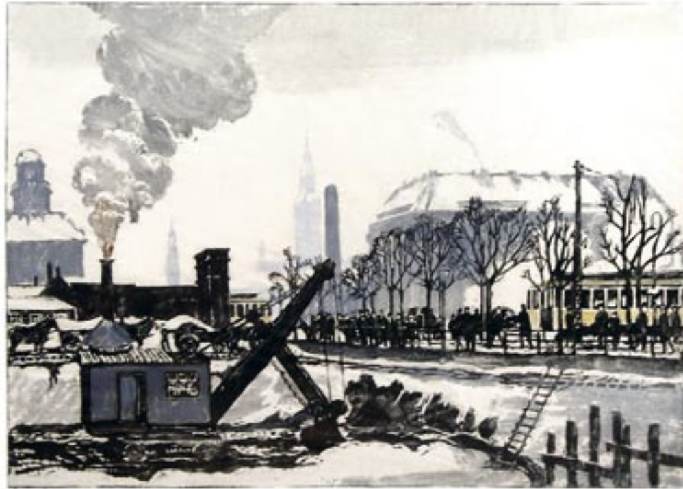
Gravkøen, Vesterbrogade, 1930 Farvetræsnit, 36 x 48 cm