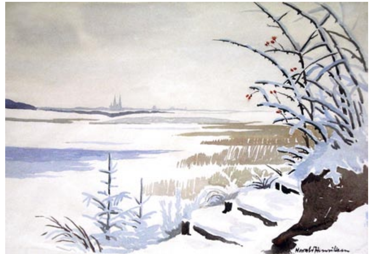
Ved Roskilde fjord, frostvinter Akvarel, 27 x 37 cm