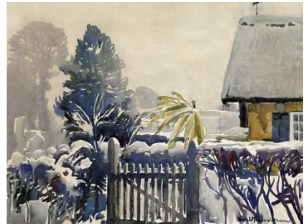
Schweizerhuset, Frederiksberg Have Akvarel, 46 x 62 cm