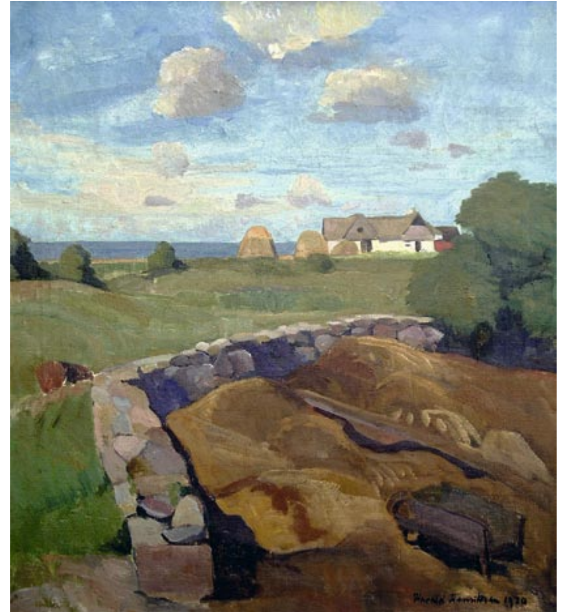
Mødding, Bjergene, 1920 Olie på lærred, 60 x 54 cm

”...også Harald H. kunne få en til at tænke på store dyr. Han har det store korpus, fylde og vægt. Og der er varme ved ham. Ligesom store dyr oftest er rolige og godmodige, sådan bringes han ikke let ud af ligevægt, lader sig ikke irritere af det som går imod”.