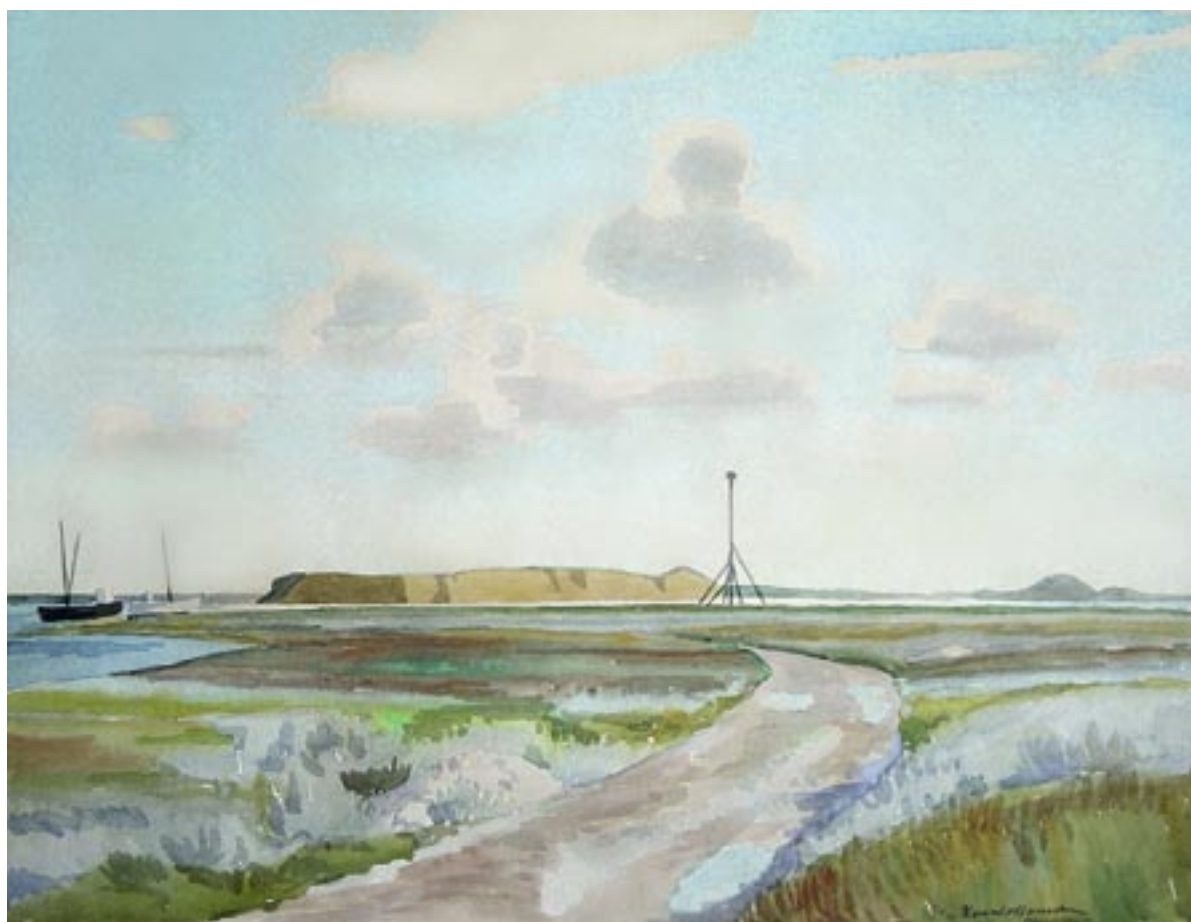
Fra Fyns Hoved, udsigt mod Mejlø, 1946