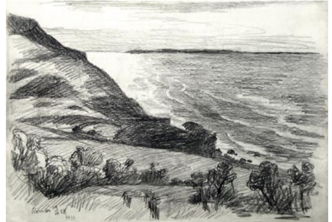
Røsnæs, udsigt over Kalundborg Fjord, 1958 Blyantstegning, 27 x 38 cm