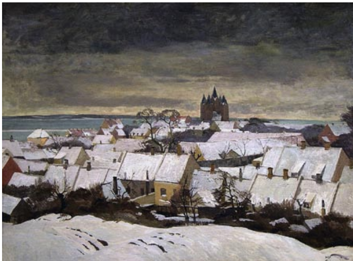
Kalundborg, 1923 Olie på lærred, 62 x 85 cm