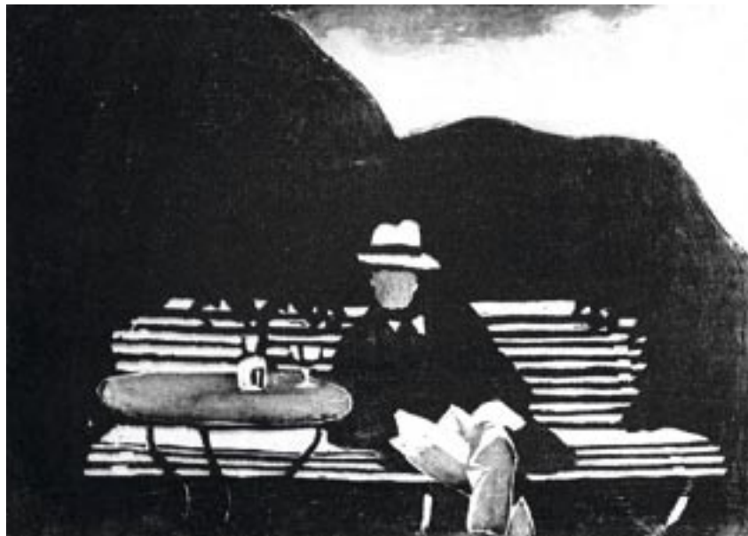
Bænken, ca. 1922 Træsnit, 22 x 30 cm