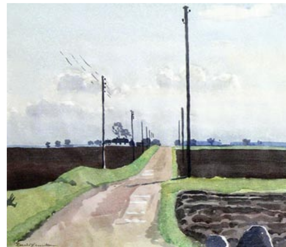
Vej med telefonpæle, ca. 1950 Akvarel, 35 x 41 cm