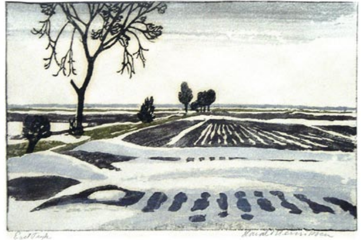
Vinterlandskab, ca. 1942 Farvetræsnit, 18 x 28 cm