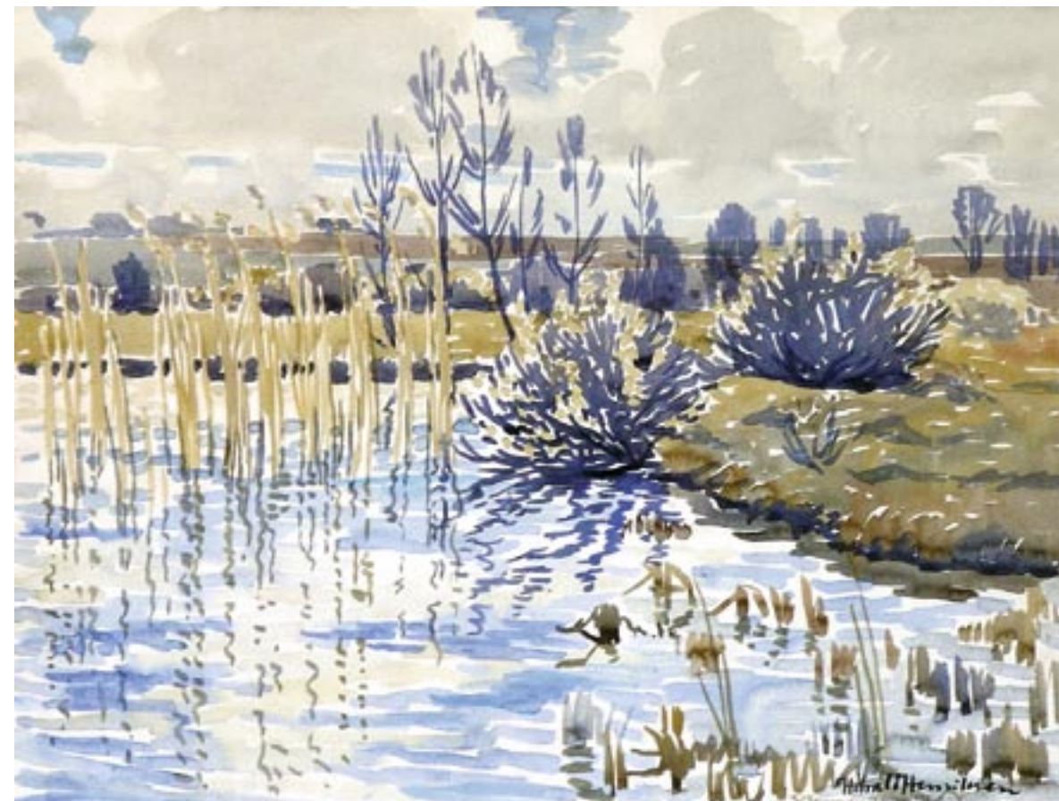
Ellemosen, Tisvilde, 1938 Akwarel, 47 x 63 cm