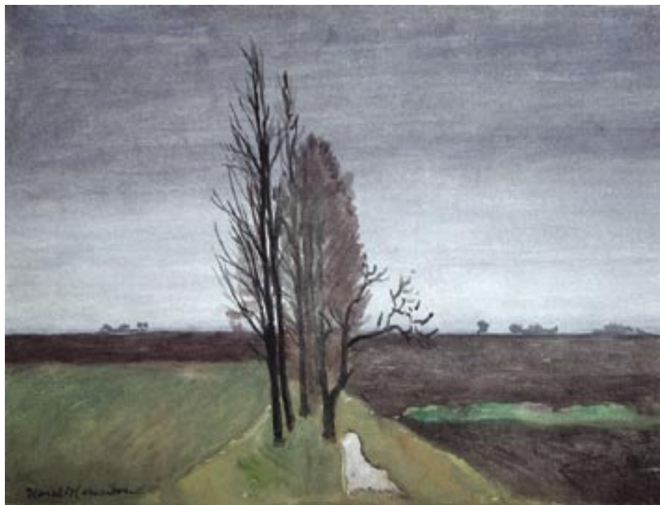
Landskab, november Akvarel, 33 x 42 cm