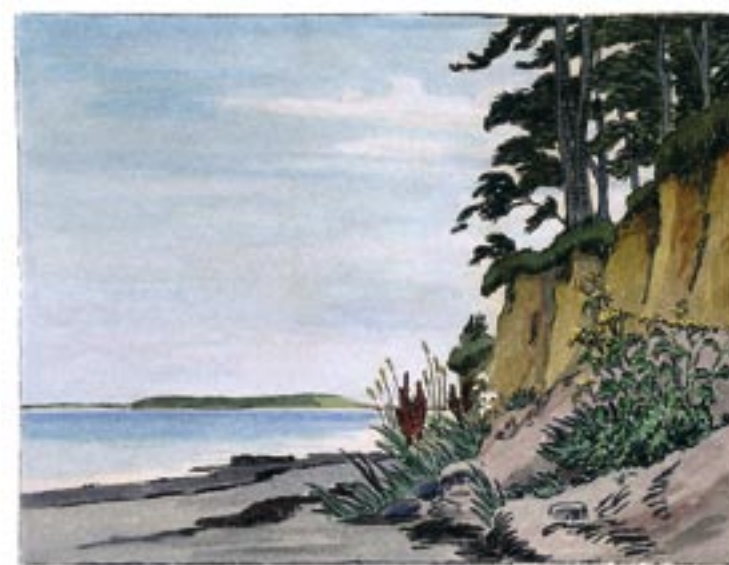
Klint ved en fjord, 1948 Farvetryk på gipsplade 21 x 28 cm