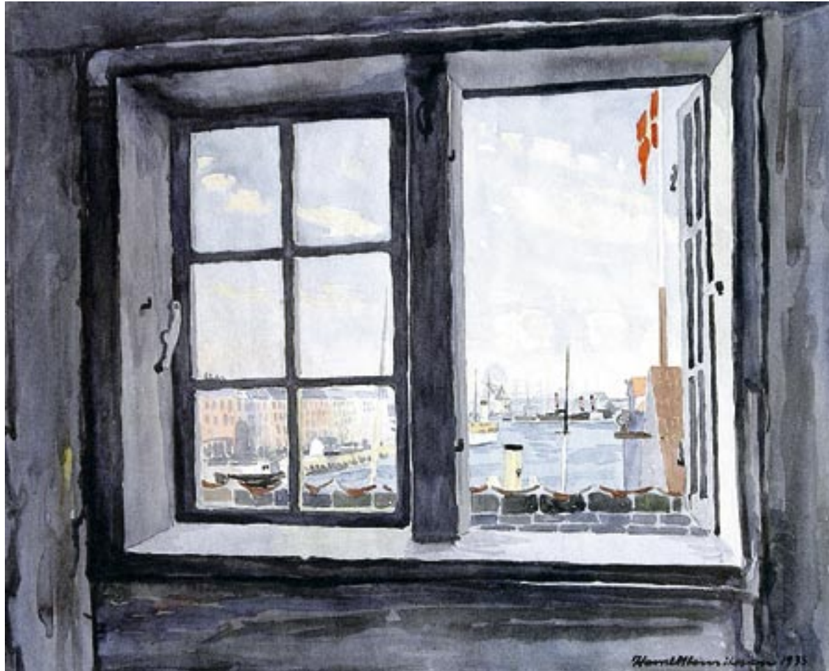
Udsigt over havnen fra Strandgade, 1935 Akvarel, 43 x 54 cm