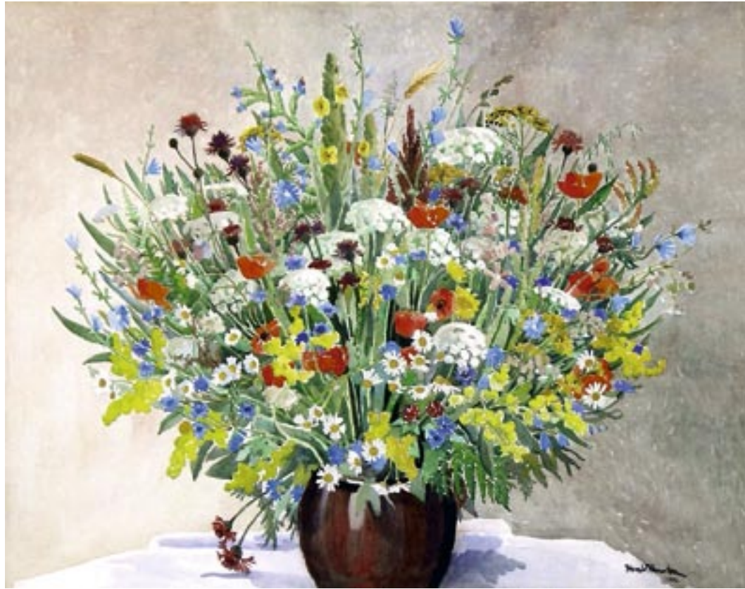
Markblomster, 1956 Akvarel, 73 x 93 cm