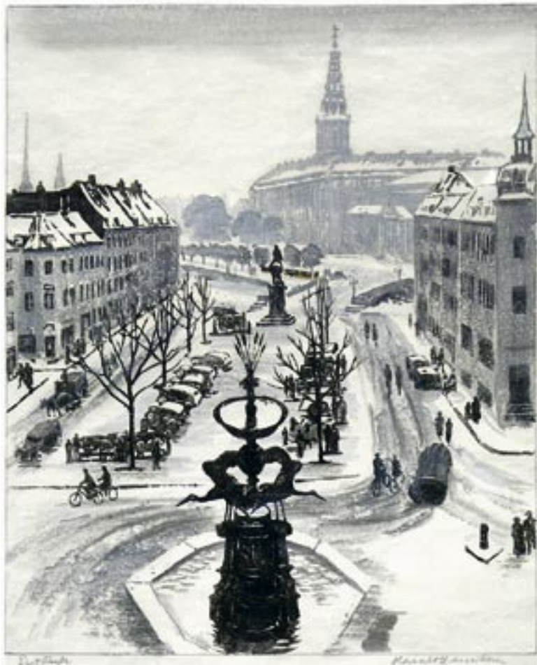
Storkespringvandet og Højbro Plads, vinter Farvetræsnit, 44 x 36 cm