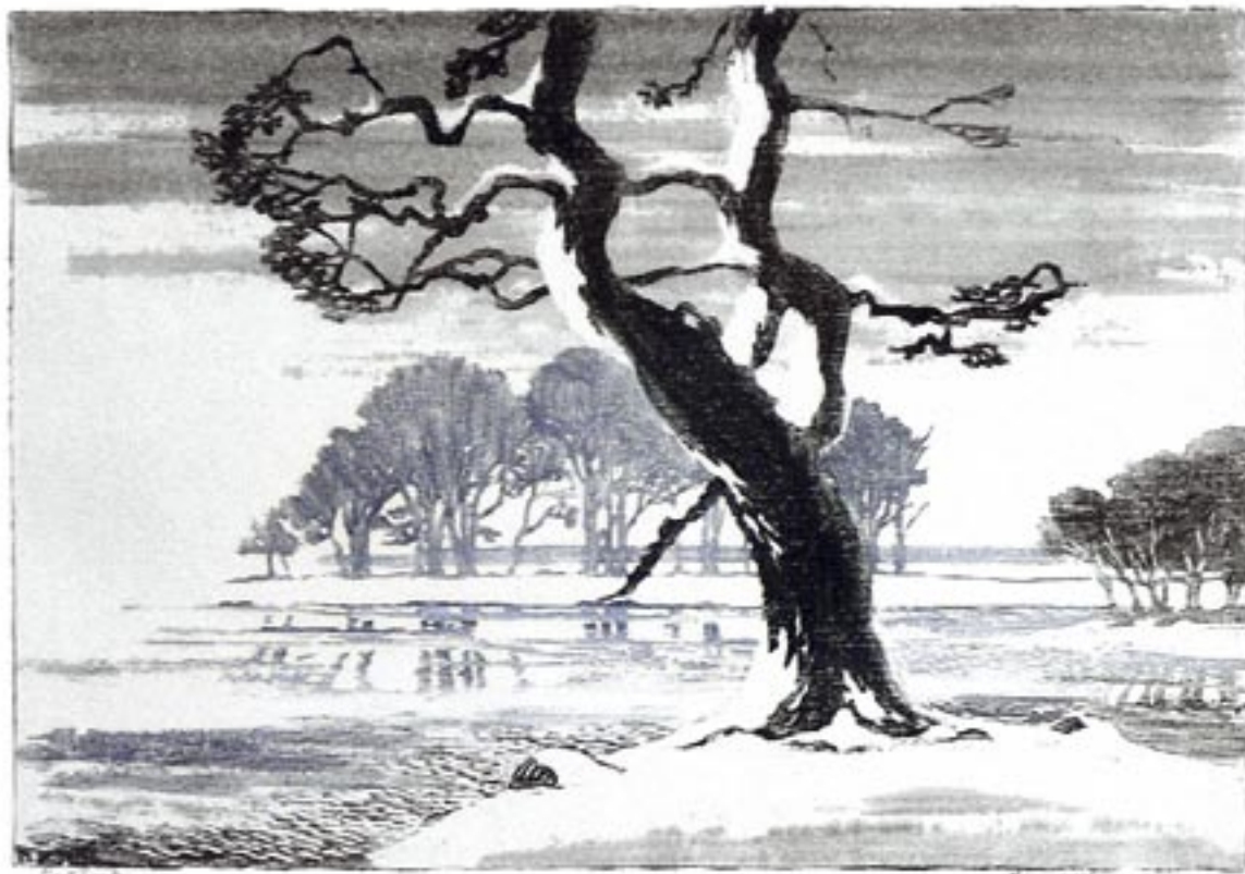
Egetræ, Skejten, ca. 1930 Farvetræsnit, 31 x 43 cm