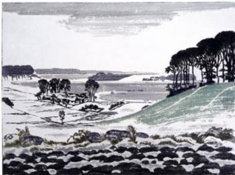
Udsigt over Bramsnæsvig, 1928 Farvetræsrit, 36 x 48 cm